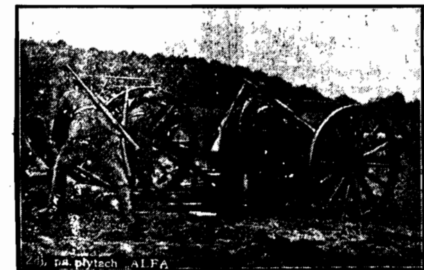
Działo na pozycji wypatruje zamaskowanego nieprzyjaciela. Za słupki posła mu śmiercionośny pocisk