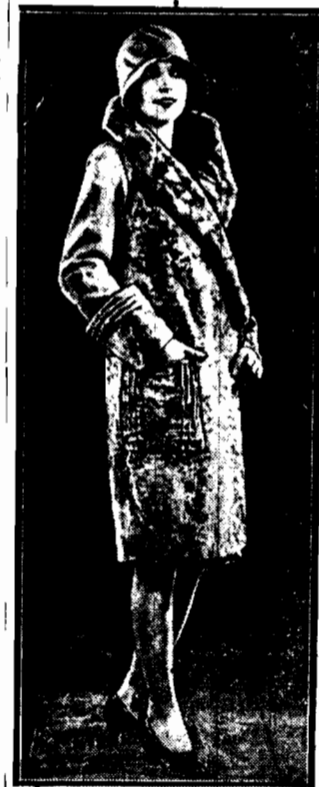
z szarych karakulów