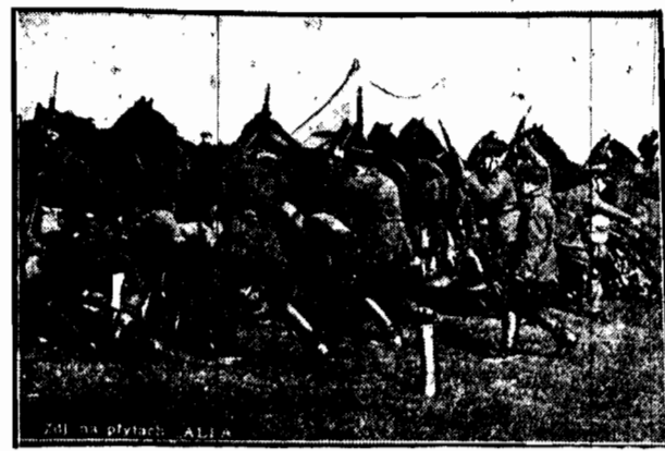
To słowo jak iskra elektryczna podrywa obojujących artylerzystów. Za dwie minuty będą gotowi do wymarszu.