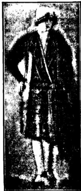
z zielonego jedwabiu stwarzająca złoczenie dzempra, z charakterystycznym kołnierzem w kształcie litery V