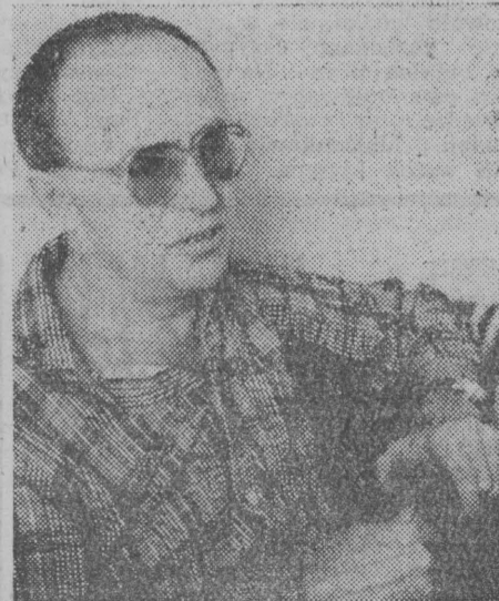
CZYTAJ NA STR. 2

Bankowcy twierdzą, że poniedziałek, 1 czerwca, był dniem jak każdy inny. Nie ustawiły się kolejki chętnych do nabycia obligacji.