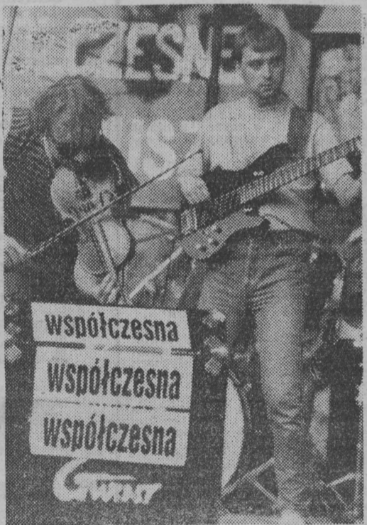
CZYTAJ (I OGLĄDAJ) NA STRONACH 4-5

Przedsiębiorstwo Wielobranżowe „CONSUMER” Spółka z o.o. w Środzie Wlkp., ul. Ks. Kegla 7