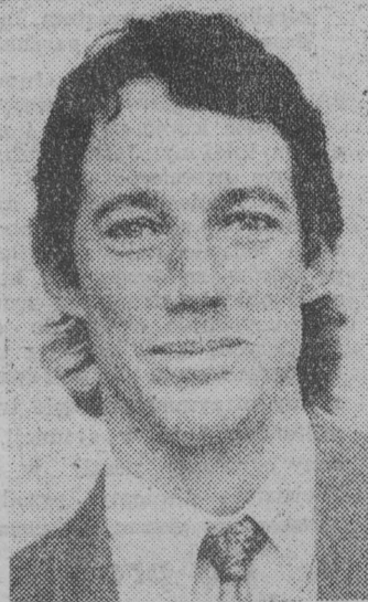
Rozmawiała: JOLANTA GADEK

— doradcy do spraw ogólnych w Urzędzie Miasta w Białymstoku, z ramienia ONZ.