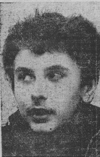
Mimo że Jagiellonia przegrała finał P.P. z Legią zyskała wiernego kibica.