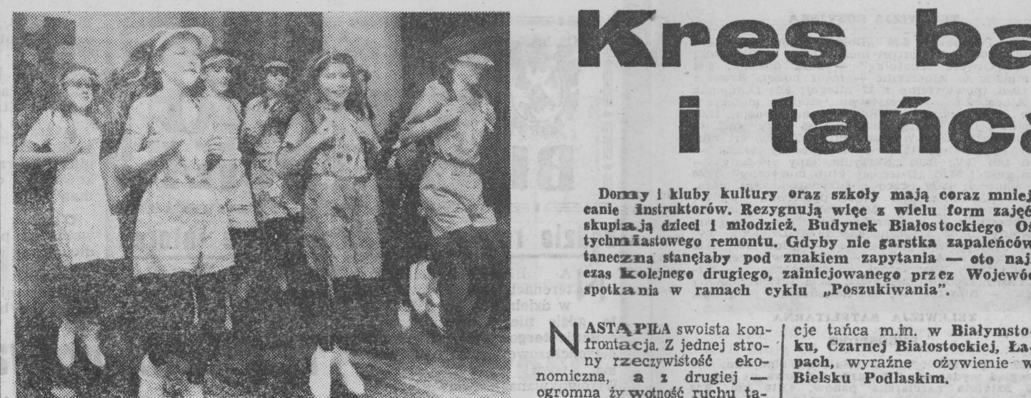
Tancezny zespół „PLAS”. Czy znajdzie sponsora?

DOM 1 plac 0,16, Sokółki ul. Targowa 26. g 1832-1