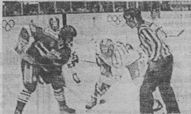
Wczorajsza porażka 1:9 z Finlandią była najwyższą w historii olimpijskich spotkań z drużyną Suomi.