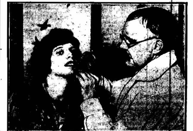
W Londynie panuje obecnie moda na tatuowanie warg. Poddano jest to operacji bardzo bolesnej, ale czego piękna kobieta nie robi dla mody.