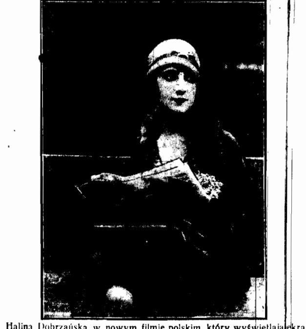
Halina Dobrzańska w nowym filmie polskim, który wyświetlają ekrany warszawskie.