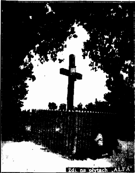
Krzyż na miejscu bohaterskiego zgonu gen. Sowińskiego