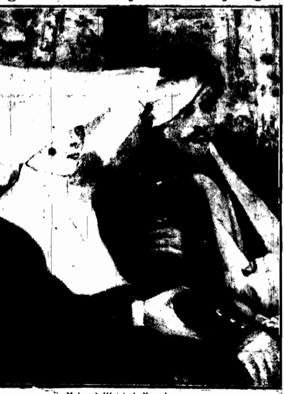
Malował Wojciech Kossak.