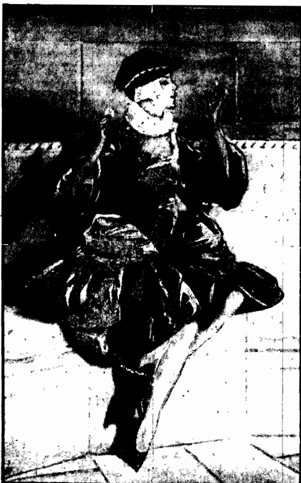
Kochane lustreczko! Mówisz mi same komplementy — ale zdaje mi się, że są one prawdziwe