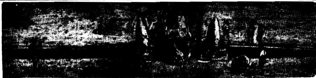
Samolot „Pohker VII” po katastrofie w Bagdadzie, według zdjęcia, dokonanego dla angielskiego tygodnika „The Sphere”.