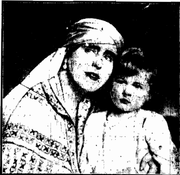
Rumuńska królowa wdowa z wnukiem królem Michałem I.

ruszył samochodem w powrotną drogę. Kierując się na Cernawodę, zwiedził wielkie porty handlowe naddunajskie Braille i Galacu.