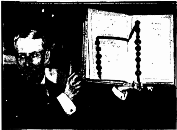
z podpisami i pieczęciami 15 państw. Drugi od końca podpis ministra Augusta Zaleskiego.