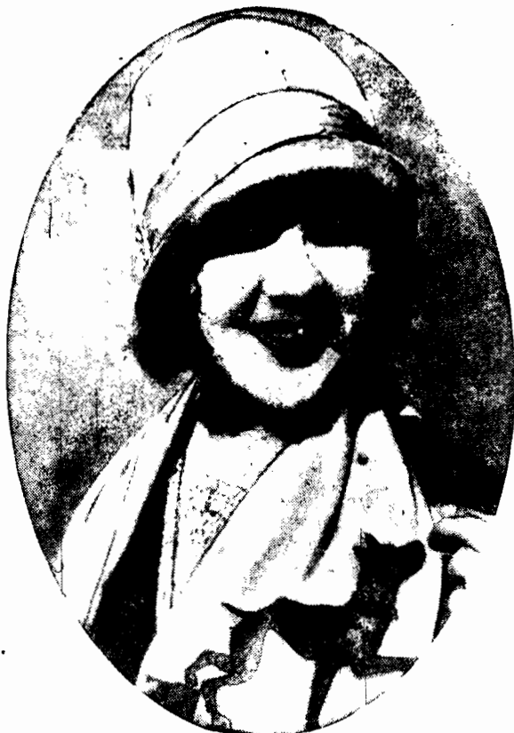
Młodziutka Mary Brian, jest jak widzimy i nader uzdolnioną malarką.