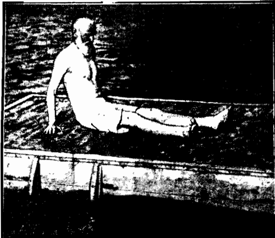
Znakomity pisarz angielski Bernard Shaw używa kąpiel morskich i słonecznych w Nicei i Cannes. Pierwszej kąpeli zażywa Shaw już o g. 7 rano.