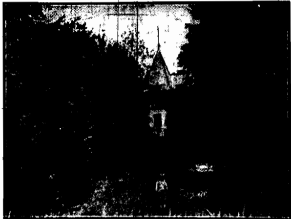
od strony parku