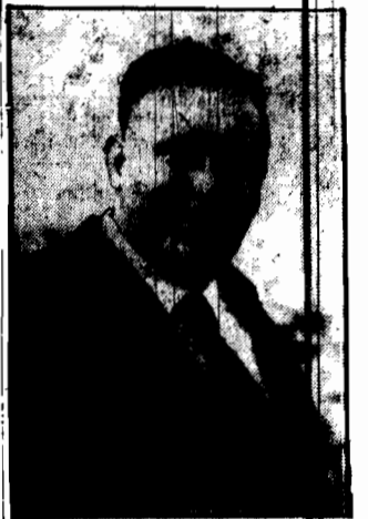
Tenor amerykański John Mac Gormack, który pobit rekord honor. otrzymanego za jeden występ 20.000 dolarów