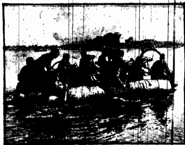
Przeprawa przez Elbę na pontonach taboru pułku.