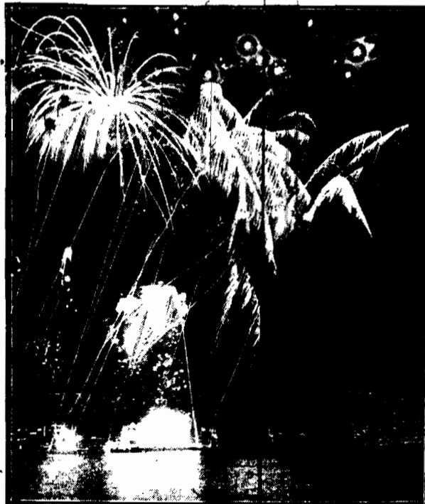
stworzony przez pirotechników na ile uwyśledzonego nleha.