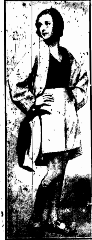
Uroczą młodzieńca „dżwig” na ręcznej pływaczce — kokieteryjnego białobronego pingwina z flaneli.