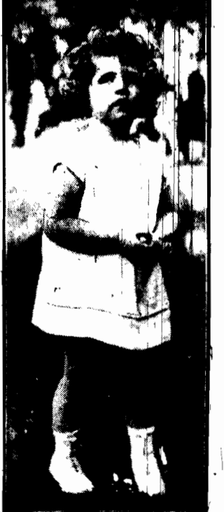
wybrane z pośród 2000 niemal równe uroczym młodocianych kandydatów do nagrody i tytułu.