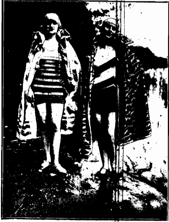
Piasiste welniane kostiumy, z moszwywnymi czapczkami i płaszczami z gumy.