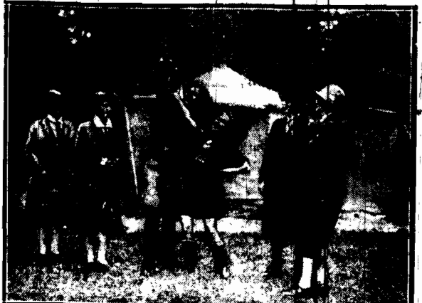
Skaunkki angielskie, które ochocho przybyły z okazyjny harcerstwa na zaproszenia „wych siostrzyce polskich do obozu pod Wyszokiem”. Wesoła zabawa z wianami przyliczka-mielniaka nastąpiła.