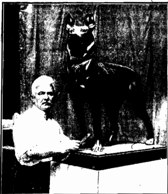
psa, który przeprowadzał niewidomych przez ulice Berlina, ma stać niedługo w stolicy Niemiec.