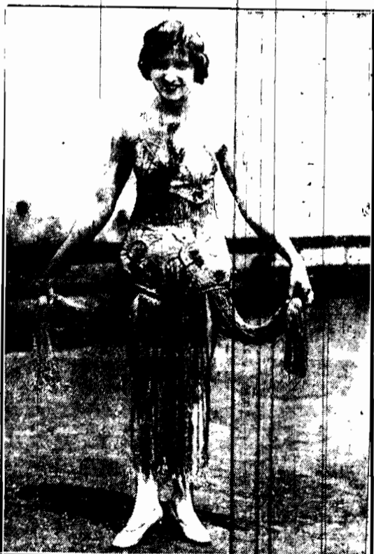
Jedyna w swoim rodzaju sukienka ekscentrycznej Amerykanki, która idealnie mody kobiecej widzi zdaje się w angielskich dziankach i w raso australijskich.