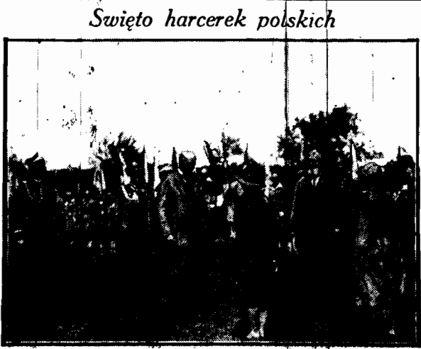
Święto harcerek polskich

Dziwny ten mąż stanu, nadużywając swej słabości, otwarcie daży do rozpoczęcia dyskusji nad egzystującymi traktatami i podeptania podpisanych przez siebie samego zobowiązań.