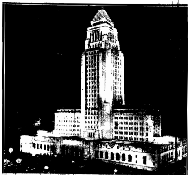
Amfiteatralnie wznoszący się ku górze drapacz nieba w Chicago, zięjący światłem z tysięcy okien, przedstawia w nocy widok niezniszczalny.