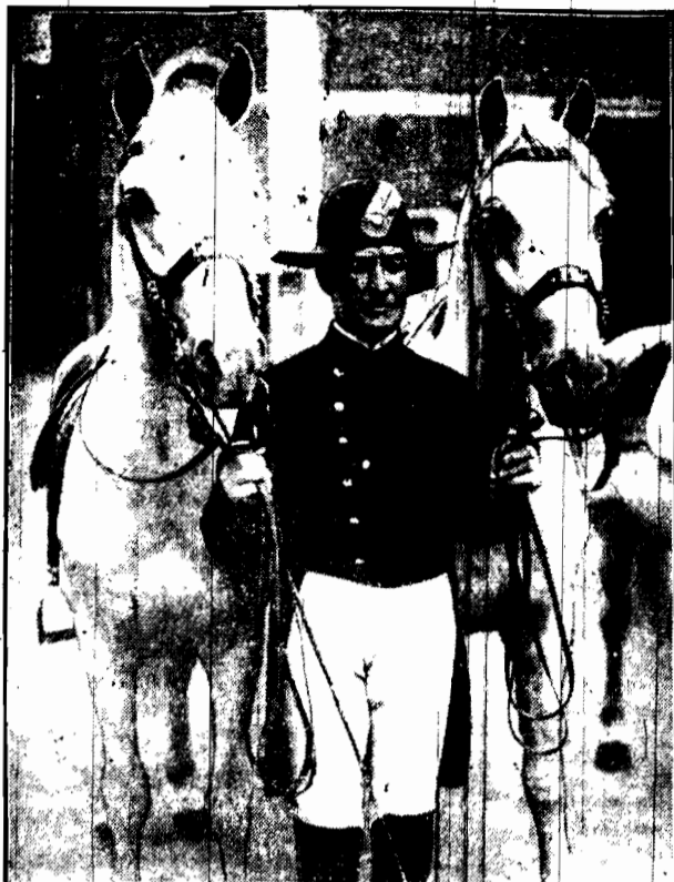
Dwa konie pełnej krwi, którym sadzone jest reprezentować barwy Austrii na igrzyskach Olimpijskich w Amsterdamie.