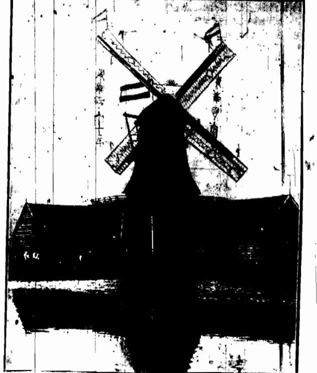
Staruszek — młyn holenderski, dawający na swym zgarbionym, choć dziełku miejsce i głośnie na strzyżbę lat, ustąpił na podzielenie na świąteczny porządek.