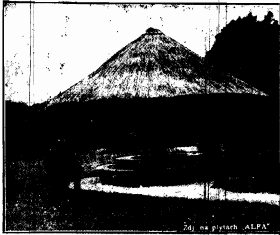
Uлюбione miejsce odpoczynku p. Prezydenta Rzeczypospolitej.