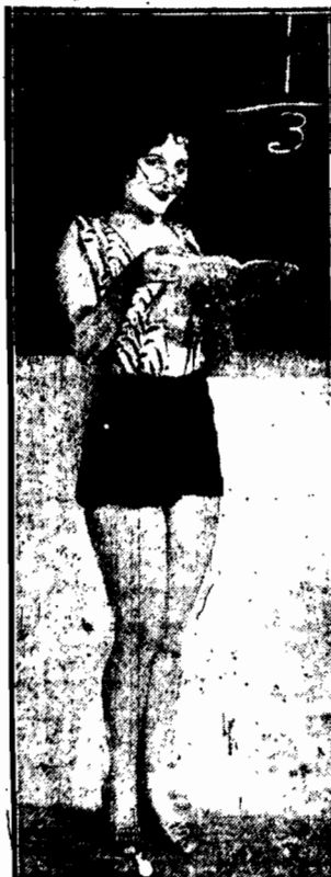
Z arytmetyki, jest nieco gorzej, zato arcy nie pozostawia nic do życzenia. Wszystko to naturalnie jest owocem starości i niegdyś amerykańskiego cyfryera.