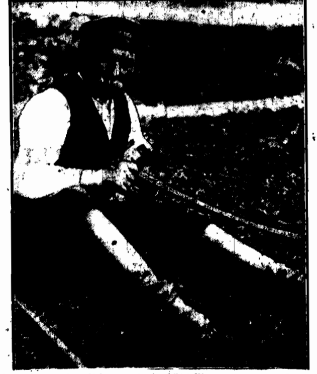
W okolicach podmiejskich, w granicach wielkiej Warszawy, rowy przyrodne. Widać zniszczenia, dająca straszenie dla wielu broni. Koszono na jej miejscu jak gwałtowne, jak na wojnie.