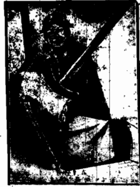
z powodzeniem konkurując ze swymi kolegami po fachu