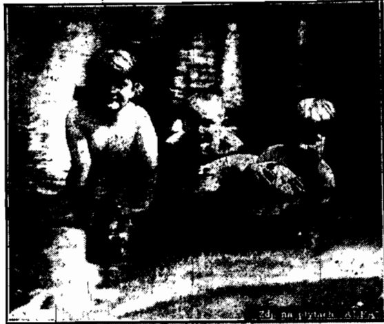
Wystarczy i mała rzeczka, do kąpiel w dni upalne.