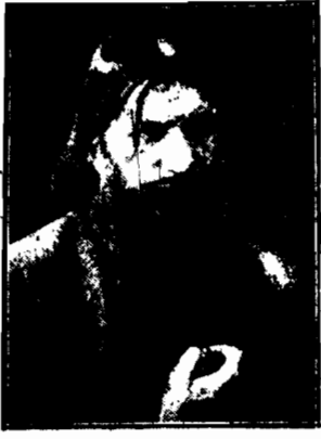
Wielki duch Rosji, zamordowany przez ks. Jusupowa i w. ks. Dymitrego.