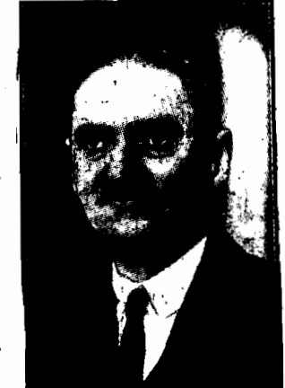
profesor węgierski, który dokonał epokowego wynalazku w dziedzinie lotnictwa, pisze spruchomienie skrzydeł płaczków.