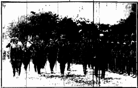
P. Prezydent Rzeczypospolitej dokonuje przeglądu pułku radjotelegrafistów wojskowych w dąbskiej kolumnie gen. Konarskiego i gen. Wróblewskiego.

okazała umowę rejentalna i zażądała sądu partyjnego nad niewiernym.