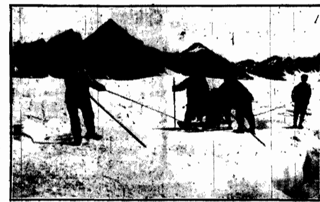
Zdjęcie dokonane na ziemi Franciszka Józefa, gdzie miał być zmuszony do lądowania gen. Nobile wraz ze swą „Italią”. Skaly, lody i śnieg.