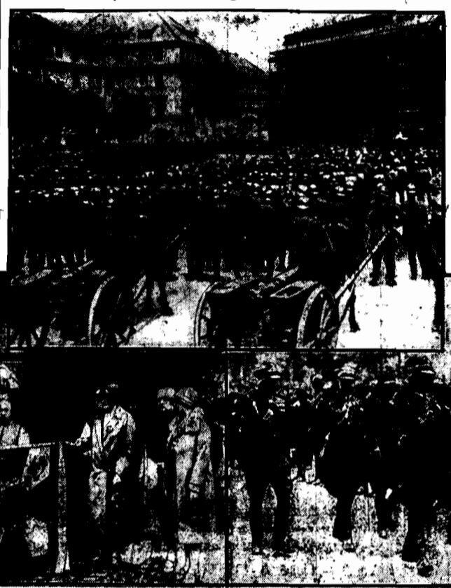
Marszałkowi Piłsudskiemu i prezydentowi m. Warszawy trzymała do chrztu chorą. Prezydent Rzeczypospolitej przechodził przed frontem oddziałów 30-go pułku, głow pułkową.