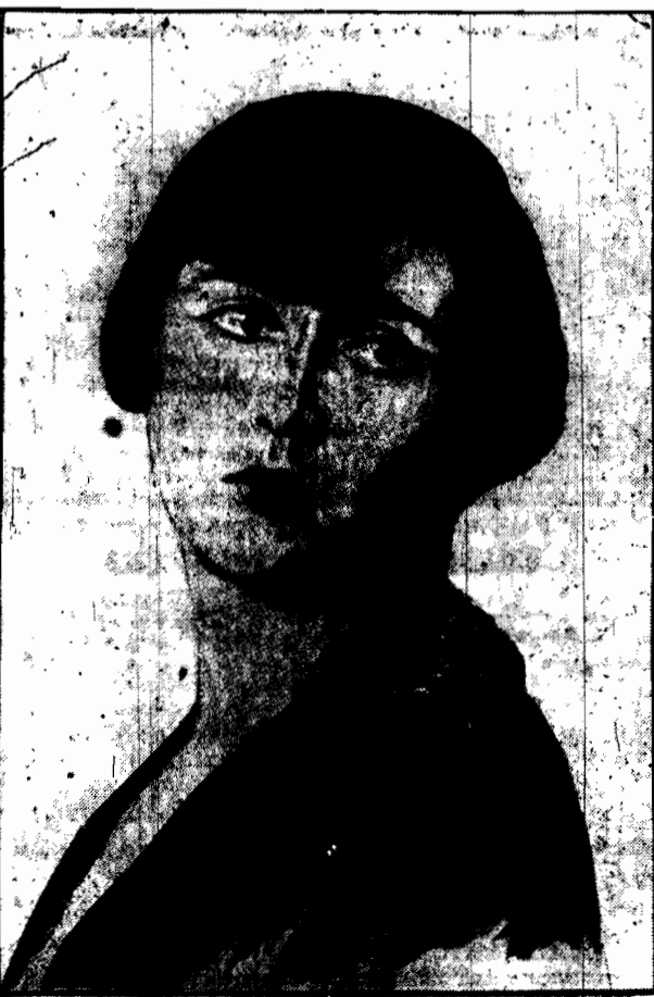
szona szwedzka sportsmanka.