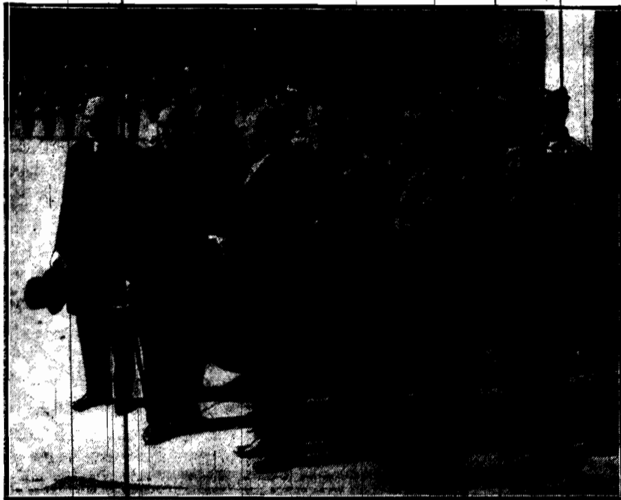
O godzinie 9-jej min 7 ruszył z dworca Głównego pociąg, wiozący przez Moskwę do Kabulu królewską parę afgańską. Na peronie grupa dostojników z o. wiceprezjerem Bartołem, ministrem Składowskim i Komisarzem Rządu Jaroczym na czele.