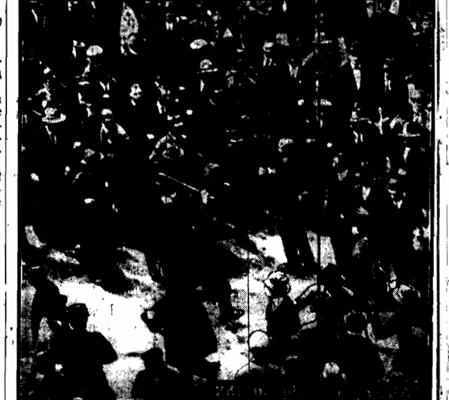
poprzedzona krwawą bójką.