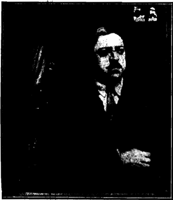
Ostatnie spojrzenie na Warszawę, już z okna wagonu, rzuca odjeżdżający przez Moskwę do Kabulu król Amanullah.