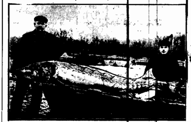
Pod miasteczkiem Maltsch powiodło się rybakom wyłowić z Odry płazowatego jesiotra wagi 250 funtów niemieckich. Obrzym ten mierzył dwa i pół metra długości