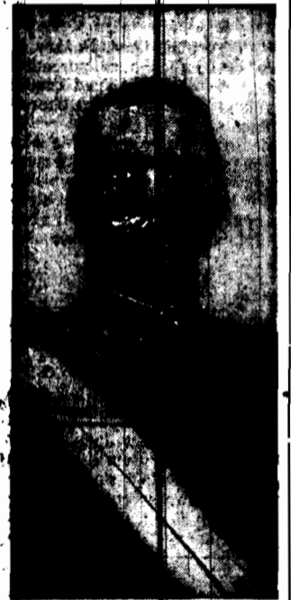
Krół WIKTOR EMANUELI

Był to zamach na króla włoskiego. Burmistrz Medjolanu wynaczył 100.000 lirów nagrody na schwytanie sprawcy zamachu.