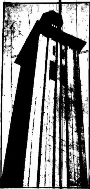
Na terenie wystawy prasy w Kolonii ukończono budowę wielkiej wieży, wysokości 85 metrów. Na najwyższym piętrze urządzona będzie restauracja, skąd zwiedzający będą mogli oglądać piękną panoramę miasta i okolic.