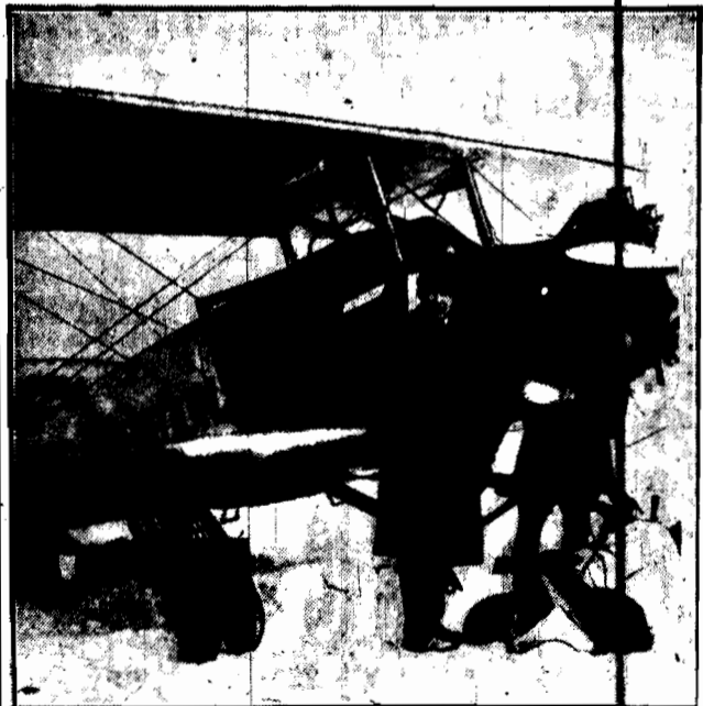
Lotnik amerykański Wilkins przygotowuje się do lotu nad biegunem północnym. Obecnie przybył do Point Barrow, dokąd też przywieziono już koty, którymi ma odbyć ryzykowną podróż.