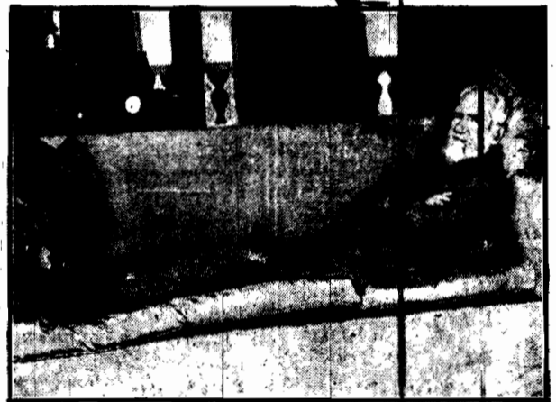
Znakomty dramaturg angielski Bernard Shaw zamieszkał obecnie w willi własnej w Whitehall-Court pod Londynem. Oto najnowszą fotografię Shawa, zrobioną już w nowej jego siedzibie.