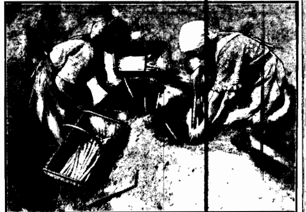
Podczas kiedy u nas za rarytas uważany jest listek sałaty inspektowej, opłacany drożej, niż na wagę złota, w Niemczech południowych zajądają już ludzie świeżutkie szparagi gruntowe