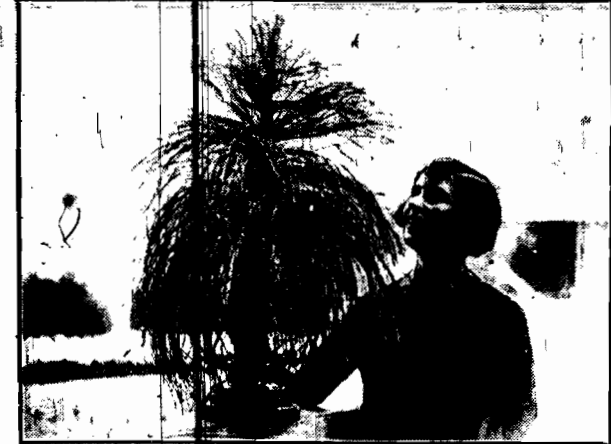
Wygląda to jak roślina egzotyczna, a jest chems zgoła innem, a mianowicie kawałkiem kabla elektrycznego, złożonego z 2000 drutów, zamienionego rączkami pomysłowej amerykanki na coś w rodzaju rośliny