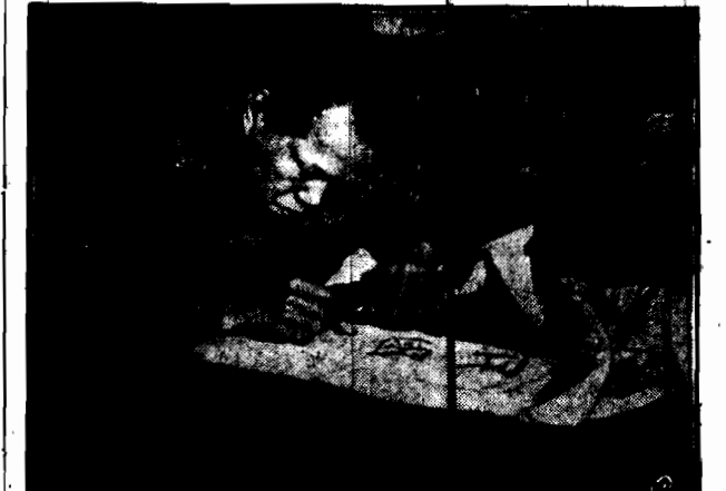
Syn generała Czang-Tso-Lina, wybitny chiński artysta malarz Czang-Tsu-Eu pracuje nad skomponowaniem nowego sztandaru chińskiego, na którym nie figurowałby emblemat dotychczasowy — złoty smok.