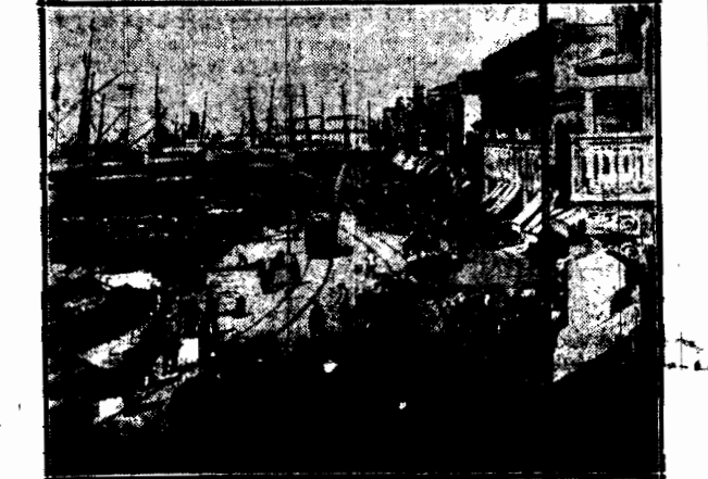
Dzielnica portowa Smyrny, odbudowana niedawno po pożarze, który obrócił ją w perzynę. Obecnie wskutek trzęsienia ziemi cała ta piękna dzielnica leży w gruzach.