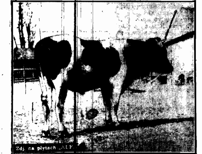
Stadnik w jednym z majątków, w grojcieckim.