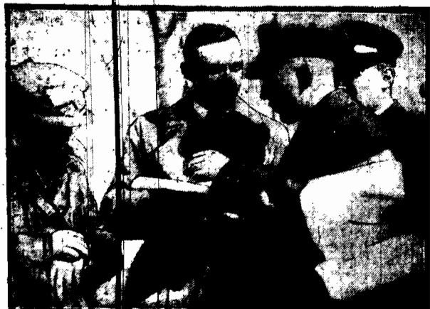
Komandor niemieckiego automobilklubu wyjaśnia pod Poznaniem trasę przez Polskę uczestnikom światowego rajdu motocyklistów.