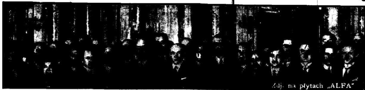
na posłuchaniu posłów „Jedynki” w zamkowej sali rycerskiej

WARSZAWA, 1.4. Posłowie i senatorowie „Jedynki” udali się wczoraj gromadnie na Zamek, aby złożyć hołd p. Prezydentowi Rzeczypospolitej. Na krótko przed godz. 3 pop. zaczęli zjeżdżać pod Zamek autami i gromadzić się na dziedzińcu Zamkowym.