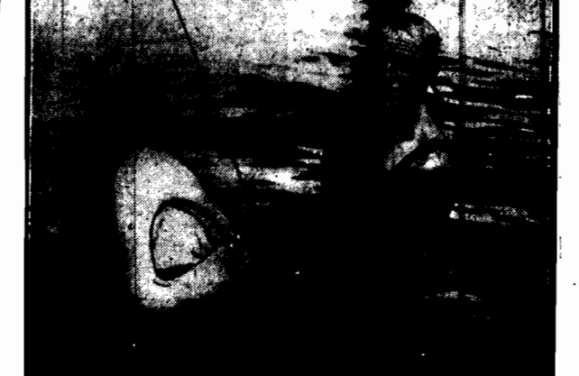
Sydney, port australijski, chętnie jest odwiedzany przez rekiny. W związku z tem powstał tam specjalny sport, polegający na łowieniu tych zwierząt. Na zdjęciu rybak ze swym łupem.