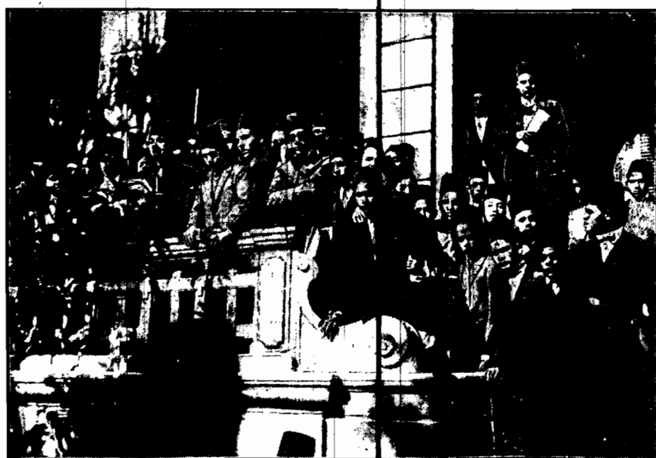
Wrzenie wśród studentów uniwersytetu w Kairze, zakończono, jaa wiadomo, krwawym starciem z policją nie uciszyło się jeszcze. Zdjęcie przedstawia wiec studentów, którego przewodniczący, odczytuje uchwały.