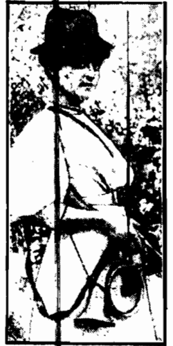
Poznać trudno w tem dziewczęciu szesnastoletnim, stojącym z flintą na stanowisku, późniejszą świetną artystkę, przedwcześnie, a tak tragicznie zmarłą ś. p. Kazimierz Niebawrowską.