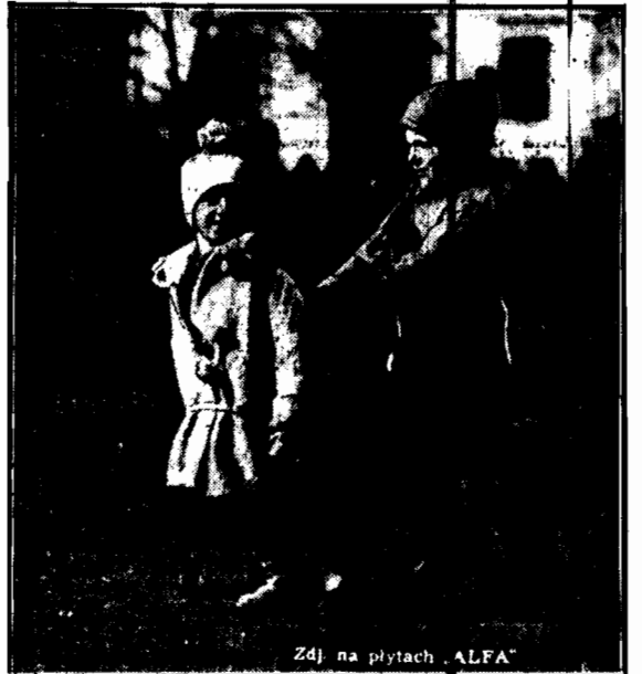
Zdj. na płytach „ALFA”

Promienne słońce wiosenne wywabło do parku dziatwę, pławiacą się radośnie w złotych promieniach. Wśród tego młodocianego towarzysstwa znajomości zawiązują się łatwo: — Bawmy się w koniki! — proponuje kawaler damie i wnet pojazd na czterech nogach zaczyna mknąć alejami parku