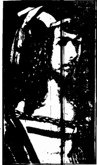
W tych dniach miało 40 lat od zgonu znakomitego norwiderskiego malarza, rytownika i sztycharza Albrechta Dürera.