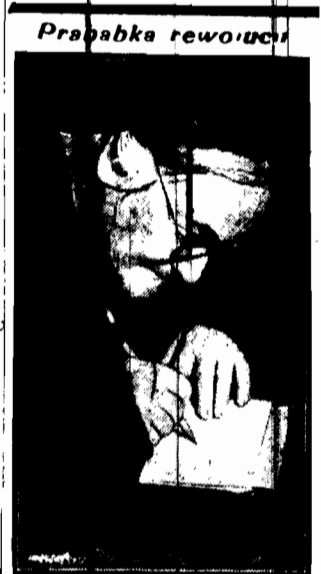
Znana rewolucjonistka Clara Zetkin, mimo późnego wieku zachowała nadal pełnię sił fizycznych i myślowych.

Powtarzając te dane, prasa berlińska donosi, że urząd spraw zagranicznych nie posiada żadnych bliższych informacji o kwestji aresztowań poza niedokładnymi