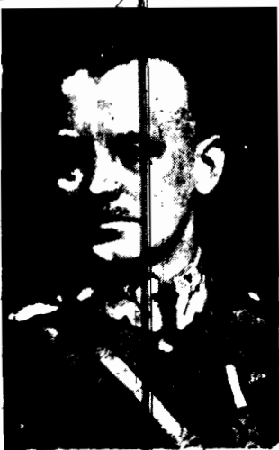
działalności wojskowej był zawsze uważany za męża przyzwołości tego obrotu partyjnego, który jego osobie dla własnych

„Dziennik Personalny” M. S. Wojsk z dnia 20 marca, zawiera zarządzenie Prezydenta Rzplitej zwalniającej gen. dyw. Władysława Sikorskiego ze stanowiska dowódcy korpusu we Lwowie. Nowego przyznanego zarządzenie Prezydenta Rzplitej gen. Sikorskiemu nie wyznacza. Zwolnienie to wywołane jest niewątpliwie dość ważnymi względami natury wojskowej, by mogły one jakiegokolwiek podlegać dyskusji. Przypomnieć tylko należy, że gen. Sikorski w ciągu całej swej działalności wojskowej był zawsze uważany za męża przyzwołości tego obrotu partyjnego, który jego osobie dla własnych celów przeciwwstawiał Marszałkowi Piłsudskiemu. Po odzyskaniu niepodległości ówczesny pułk. Sikorski był dowódcą grupy pod Lwowem, zaś w r. 1920 dowodził zwycięską 5-tą armją, poczem przez Naczelnika Państwa, mianowany był szefem sztabu generalnego. Po zamordowaniu Prezydenta Narutowicza, na wniosek Marszałka Piłsudskiego, utworzył gabinet, a w gabinecie p. Wł. Grabskiego był ministrem spraw wojskowych. Na stanowisku tem poczynił szereg ustępstw z budżetu wojskowego, co wywołało rozgorczenie w armji. Doszło ono do zenitu, gdy gen. Sikorski przeciwstawił się powrotowi Marszałka Piłsudskiego do armji. Od roku 1926 gen. Sikorski zajmuje stanowisko dowódcy korpusu lwowskiego i długo jeszcze jest uważany przez rozgorczonych i zawiedzionych w swych nadziejach polityków za przyszłego dyktatora z ramienia partynictwa prawicowego.