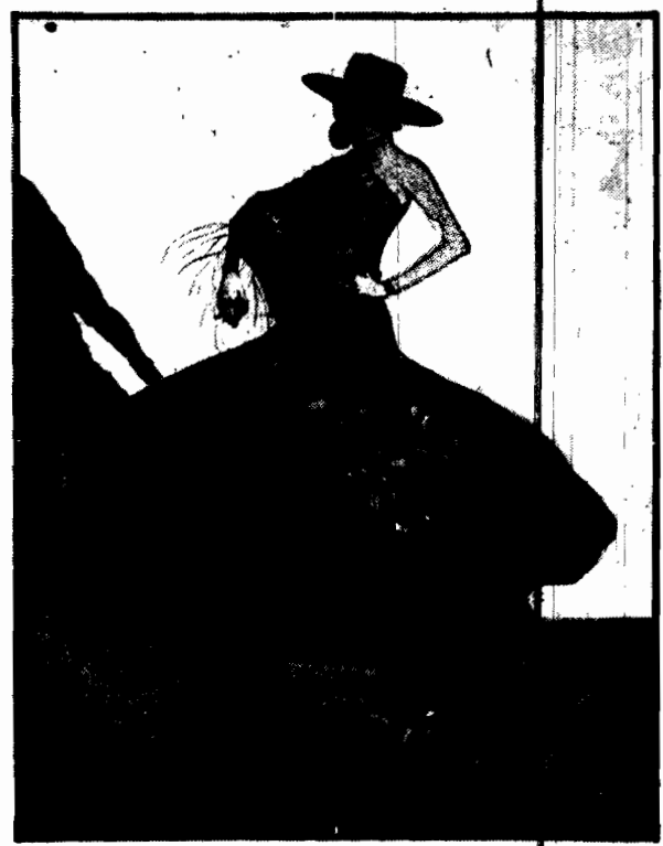
Do najpiękniejszych i najomniejszych tańców narodowych należy taniec hiszpański z kastanietami. Jest w nim namilność i duma, walek i przedziwna miękkość. Jest to taniec prawdziwie popularny i rozrywający krew nie tylko w tancerzach, ale i w patrzących. Tańca tego nie może tańczyć mięskoką blondynka. Jest to taniec kobiet czarnych, jak szpada, krumpholtzów i czarnoczek.

BERLIN 21.3. W Górach Olbrzymich niejaki Günther wraz ze swym siostrzeńcem spowodowali podczas wycieczki narciarskiej runięcie lawiny. Günther zdołał się utrzymać na powierzchni lawiny, siostrzeńiec jego natomiast, dostawszy się pod masę śniegu, poniósł śmierć na miejscu.