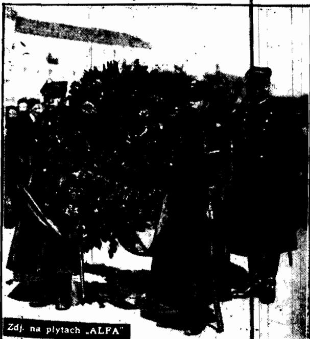
Zdjęcie na płytach „ALFA” Delegacja 8 pułku ułanów krakowskich z wieńcem u stóp pomnika Szela swego pułku w Warszawie.