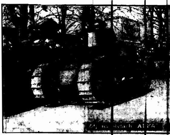
Szafeta czołgów w drodze do Belwederu.