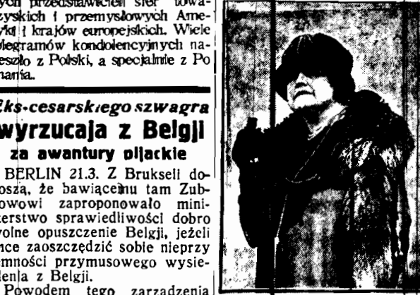
Stronnictwo demokratyczne Stanów Zjednoczonych na stanowisko wiceprezydentki państwa wysunęła kandydaturę wdowy po prezydencie Wilsonie.