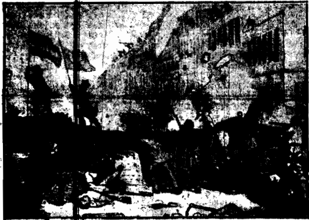
Zdjęcie ze starego albumu przedstawiającego scenę z t. zw. rewolucji marcowej, wybuchłej 13-go marca 1848-go roku w Berlinie i szeregu miast niemieckich. Na tarykadzie obok niemieckiego wznosi się sztandar polski, razem z Niemcami walczyli i Polacy o wolność ich ojczyzny.