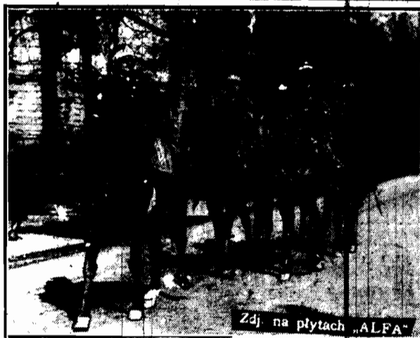
Zdj. na płytach „ALFA”

— Rosyjska delegacja do rokowań z Niemcami wróciła do Moskwy.