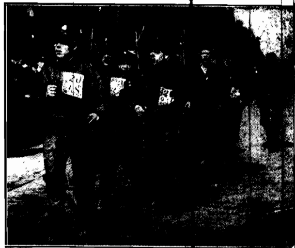
Pierwsza u mety — drużyna 48 pułku strzelców, kresowych.

W Trzyczcu Polacy zdobyli 14 mandatów (Czesi i Niemcy po 11), w Mostach — 8 (Czesi 7), w Lesznie Dolnym — 16 (Czesi 2, Niemcy 1), w Książu — 17 (Czesi 8), w Lesznie Górnym — 7 (Czesi 3), w Gródku — 13 (Czesi 2), w Bukowcu — 12 (Czesi 6), w Szumbarku — 10 (Czesi 8).