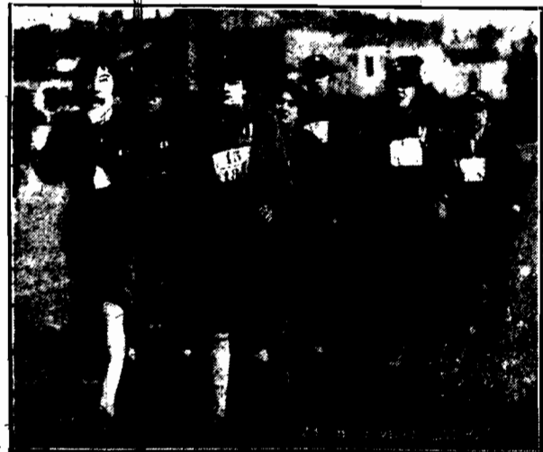
Szczepczym z Wołynia w marszu

Norwskie koleje państwowe zakupiły w drodze przetargu 25.000 ton węgla górnośląskiego. Na przetargu duńskich kolei kopalnie polskie uzyskały kontrakt na dostawę 54.000 ton węgla.