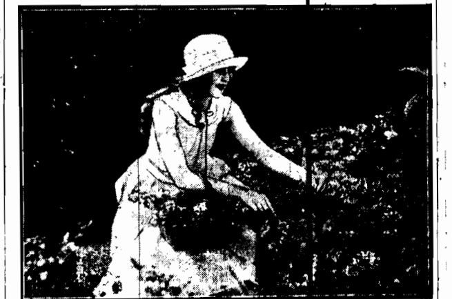
Zbiera kwiaty wiosenne a sama wygląda jak wiosenny kwiat. Oczywiście dzieje się to gdzieś na południu. U nas na łakach leża jeszcze śnieg