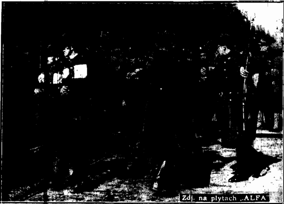
Zdj. na płytach „ALFA”