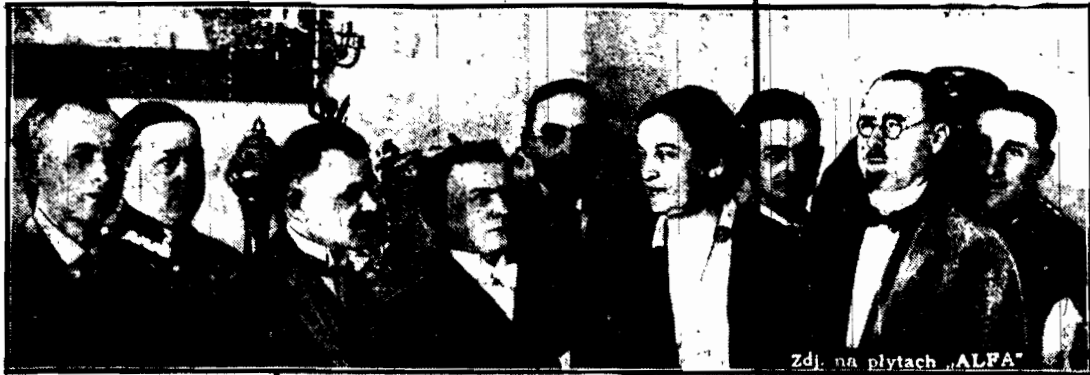
Pani Marszałkowa przyjmuje delegację Polaków, przybyłych z Niemiec z życzeniami imieninowemu.