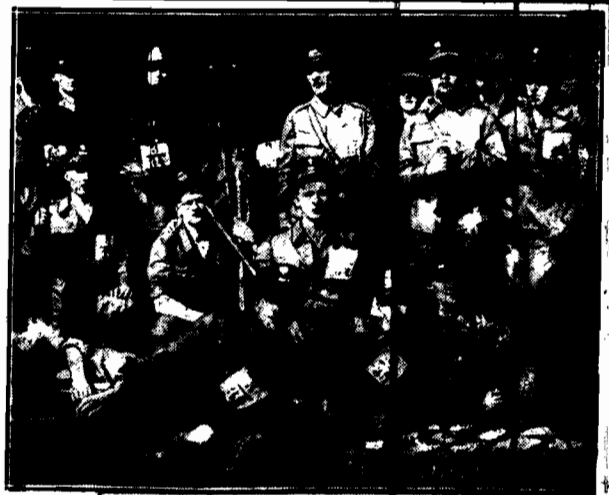
Drużyna policyjna po ukończeniu marszu