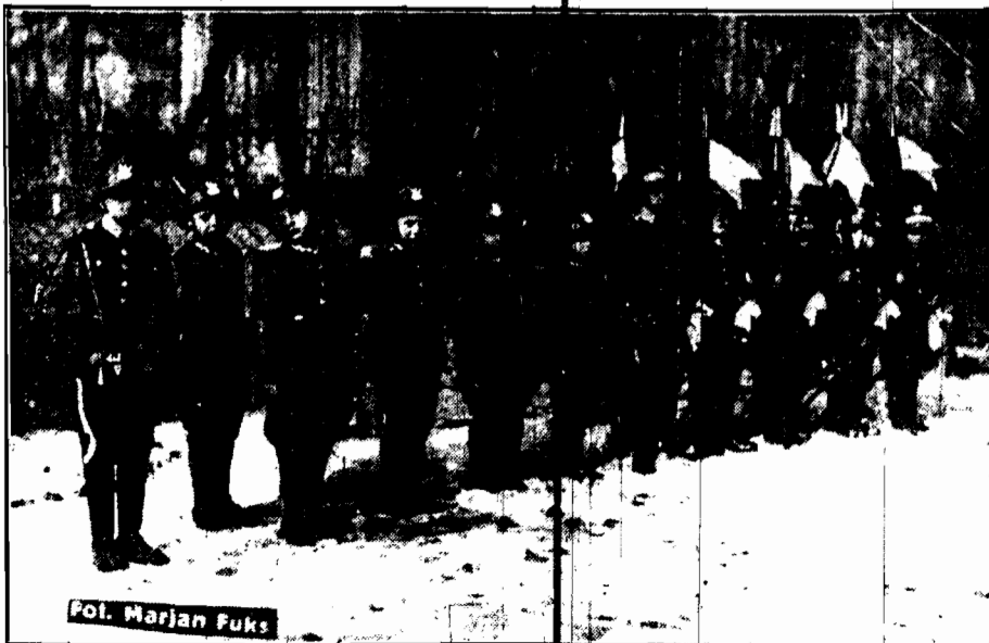
Fot. Marjan Fuks