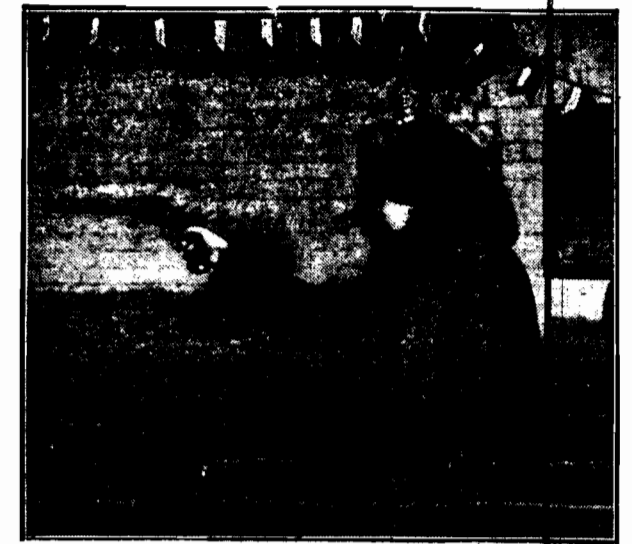
Pierwszy strzał oddany onegdaj rano na otwarcie kobiecych zawodów strzeleckich w Warszawie.