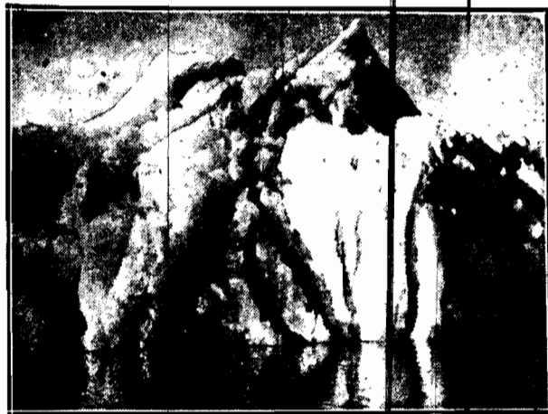
Pływające po oceanach góry lodowe stanowią wielkie niebezpieczeństwo dla okrętów...