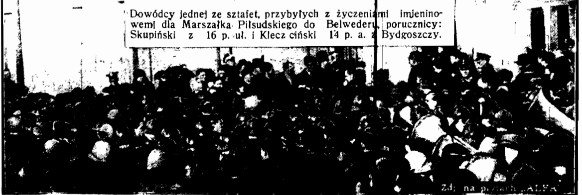
Manifestacje na cześć Marszałka Piłsudskiego w Belwederze po wielkiej akademii w sali Colosseum

W połowie lipca r. b. odbędzie się w Paryżu konferencja pracy społecznej, która połączona będzie ze specjalną wystawą poświęconą opiece społecznej. Zarówno w konferencji jak i w wystawie Polska weźmie udział. Organizacje polskich pracowników społecznych urządzają w związku z tem narady przygotowawcze.