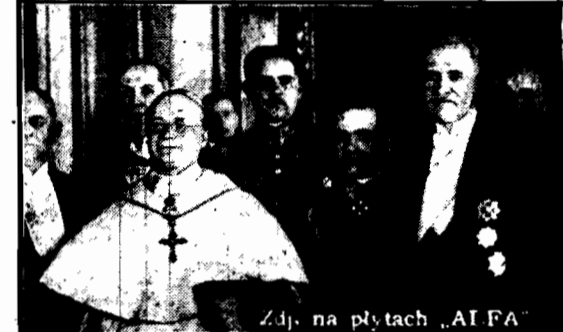
Zdj. na płytach „ALFA”