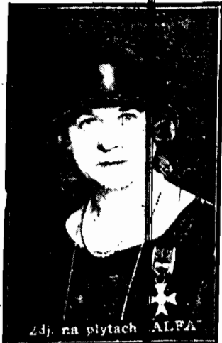
Zdjęcie na płytach ALFA