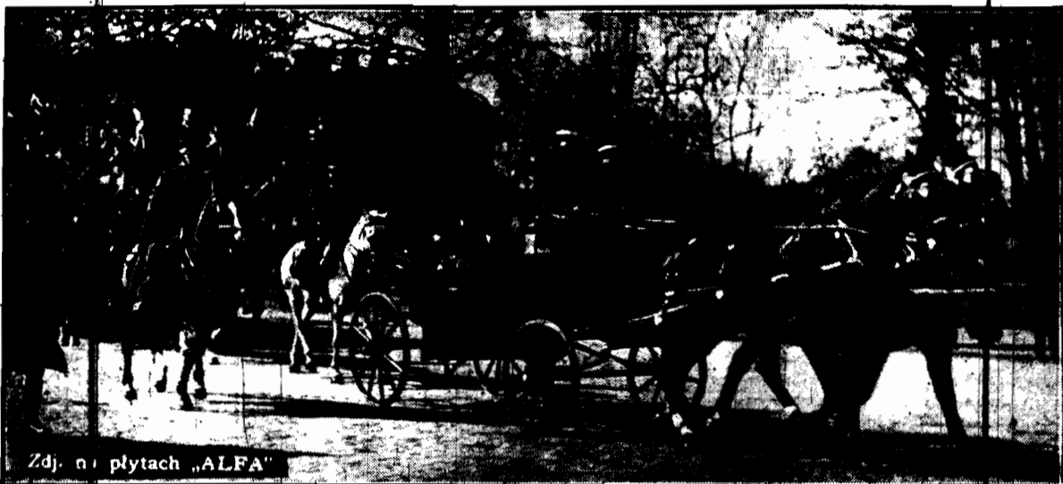
Zdj. na płytach „ALFA”

Redakcja Rynek Kościuszki 1, tel. 63. — BIAŁYSTOK — Administracja: Legionowa 1, tel. 11. Konty p.k.o. 64.106