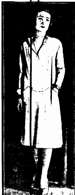
Gładka, skromna, z długimi rękawami i niewielkim wycięciem suknia domowa.