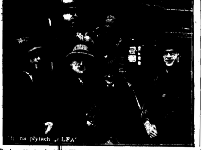
na płytach „LFA” P. Iwaszkiewicz, Lech i Wierzyński jada do Pragi, aby tam wystąpić w „wieczorze modeli poezji polskiej”.