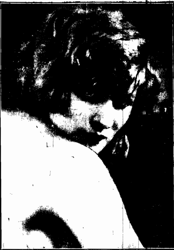
Typ piękności jasnowłosej stanowi znana artystka szwedzka, Greta Nissen, bawiąca chwilowo na występach w Ameryce.