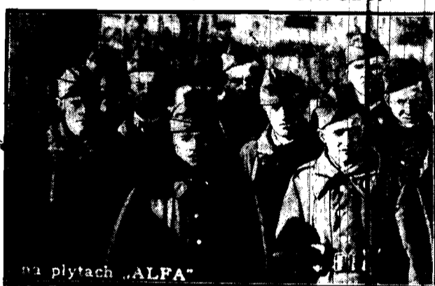
Grupa zwycięzców w zawodach eliminacyjnych Baonu manewrowego w Rembertowie. Grupa ta wykonała marsz dystansowy Sulejówek - Belweder.