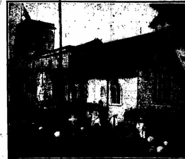
Pogrzeb świeżo zmarłego angielskiego polityka i męża stanu lorda Oxford and Asquith odbył się w miasteczku Sutton Courtney...