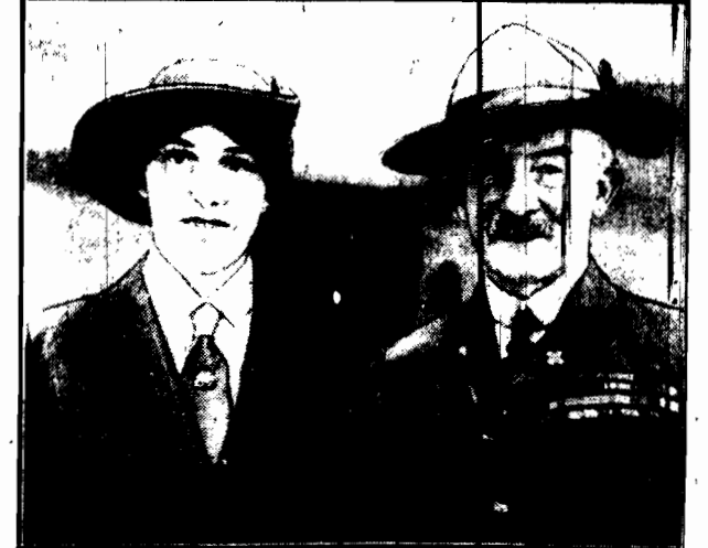
Twórca hardcerstwa general angielski Baden Powell obchodzi w tych dniach 70-tą rocznicę urodzin w pełni sił i zdrowia. Na zdjęciu z prawej, Powell z żoną.