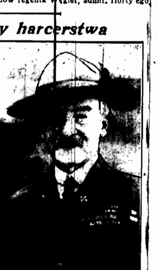
Twórca harcerstwa generał angielski Baden Powell pochodził z tych dniach 70-letnicznym przedwiosem w pełni sił i zdrowia. Na zdjęciu, gen. Powell z małżonką.