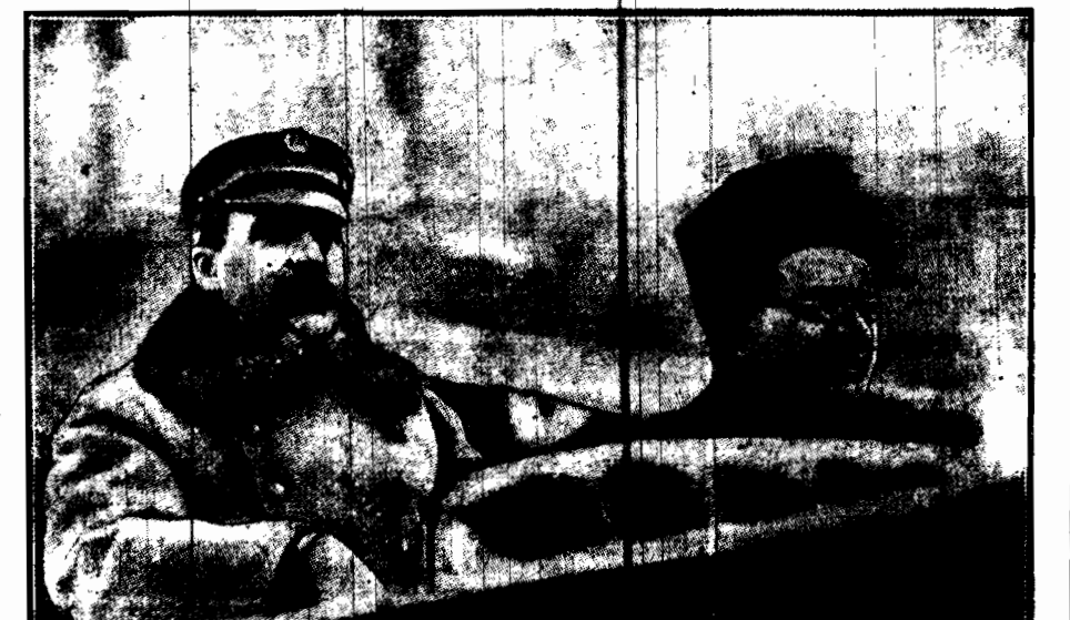
Monsignore Ratti, obecny Papież i Marszałek Piłsudski

Jak doniosły depesze, Ojciec św. Plus XI, polecił, by na jednej ze ścian odnawianej obecnie w Rzymie kaplicy Loretańskiej umieszczono obraz, uwieczniający po wszystkie czasy zwycięstwo Marszałka Piłsudskiego nad wspólnymi wrogami chrześcijaństwa, m. skiewską armią bolszewicką w roku 1920. Na obrazie, obok Marszałka Piłsudskiego, wyobrażony będzie ówczesny nuncjusz w Warszawie mgr. Ratti, obecny papież Plus XI. Fresk ten będzie niejako odpowiednikiem innego, umieszczonego na ścianie równoległej, a wyobrażającego zwycięstwo Sobieskiego pod Wiedniem. W ten sposób Ojciec święty daje wyraz swemu uznaniu dla Marszałka Piłsudskiego, jako dla obrońcy chrześcijaństwa przed gnawą hord, dotkniętych trudem bezbożności i ateizmu. Wkrótce więc ze ścian kaplicy spojrząć będą na siebie dwaj wielcy rycerze, walczący pod znakiem Krzyża: Sobieski i Piłsudski. A to ku tem większej chwale Imienia Boskiego i ku tem większej stawie Narodu Polskiego i jego Wodza. Fotografia nasza przedstawia wyjazd na front wschodni w r. 1919 Marszałka Piłsudskiego, któremu w tych ciężkich chwilach zmagania się z wrogiem towarzyszy ówczesny nuncjusz apostolski w Warszawie, obecny Ojciec święty papież Plus XI.