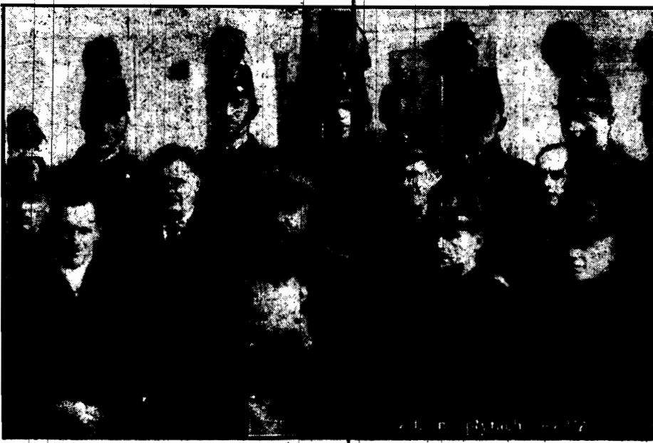
W czasie przyjazdu delegatów zjazdu Federacji związków obrońców Ojczyzny.

BERLIN. 27.2. W Wilhelmshaven spuszczane mają być na wodę w połowie marca nowe cztery wielkie torpedowce niemieckie. Równocześnie stocznie w Wilhelmshaven rozpoczynają budowę dużego krążownika wojennego.