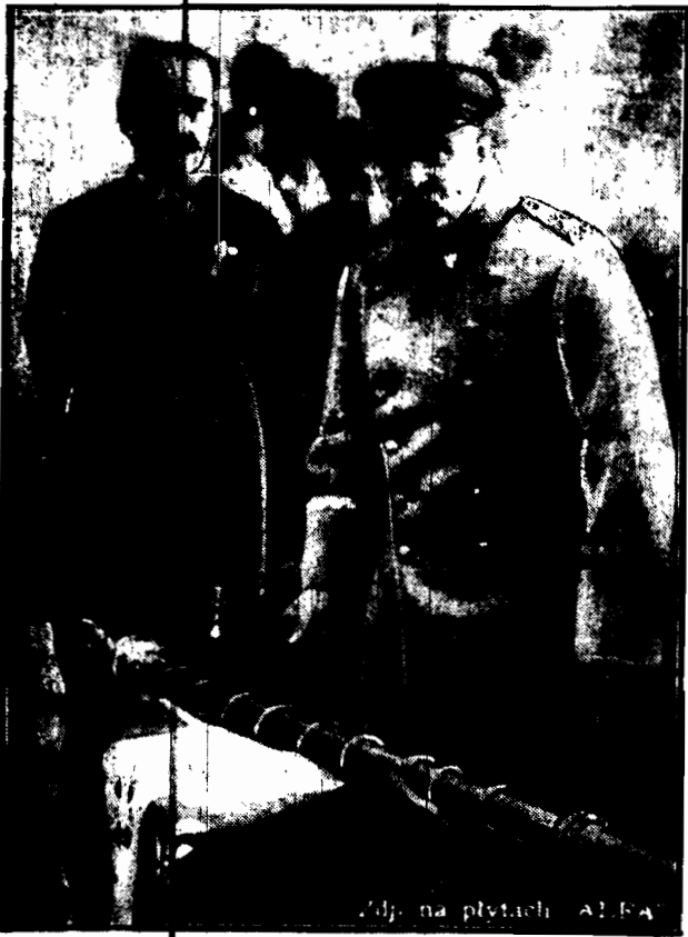
„Dziś na płytach A. I. S. A.”