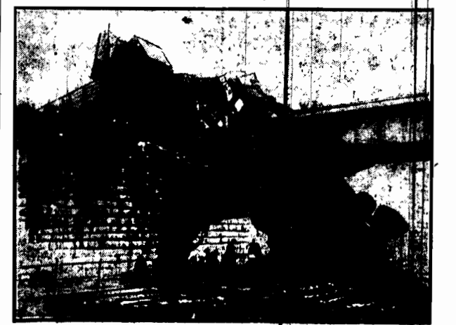
W pobliżu stacji Heiligenstadt pod Wiedniem wyjechała się i uderzyła w kolumnywa pociągu pasażerskiego. Kilka wagonów śmiało pasażerskiego zderzenia; 8 osób odniosło ciężkie rany.

KRYNOLINOWI SEDZIOWIE Strój czasów już zamierzchłych. — wielka krynolina. Świeże wszakże zdarzenia dzisiaj przypomniał. Bał - konkurs krynoliny dano w karnawale. Damy wlec na ów konkurs, odziane wspaniale. Przybyły tam nadzieją nagrody znaczone. Cóż, kiedy każdy z sędziów nagrodził swą żonę.