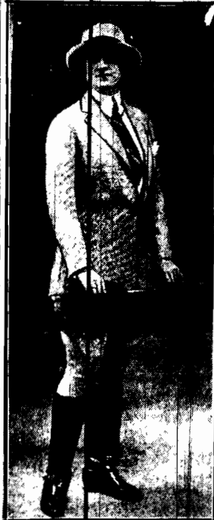
Elegancki kostium damski do konnej jazdy, niczem się różniący się od męskiego, a zastępujący świetnie niewygodną amazonkę.