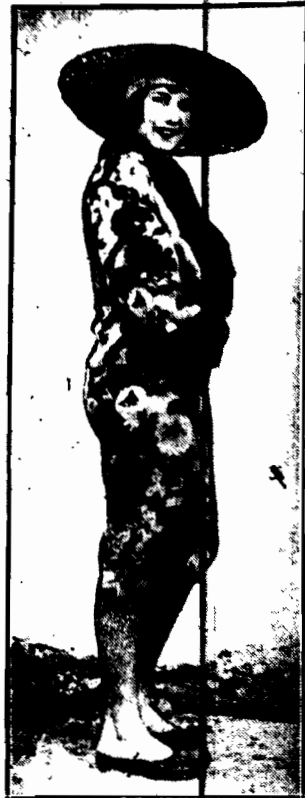
Na plażach amerykańskich nadobne ku racuszki wprowadziły mode noszenia wielkich kapeluszy amerykańskich