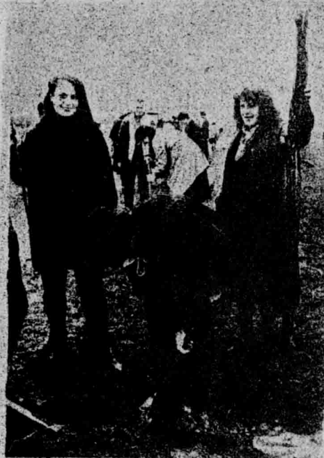
SADZENIE DEBÓW PRZEZ CZŁONKÓW LOP NA ULICY ZAWADZKIEJ