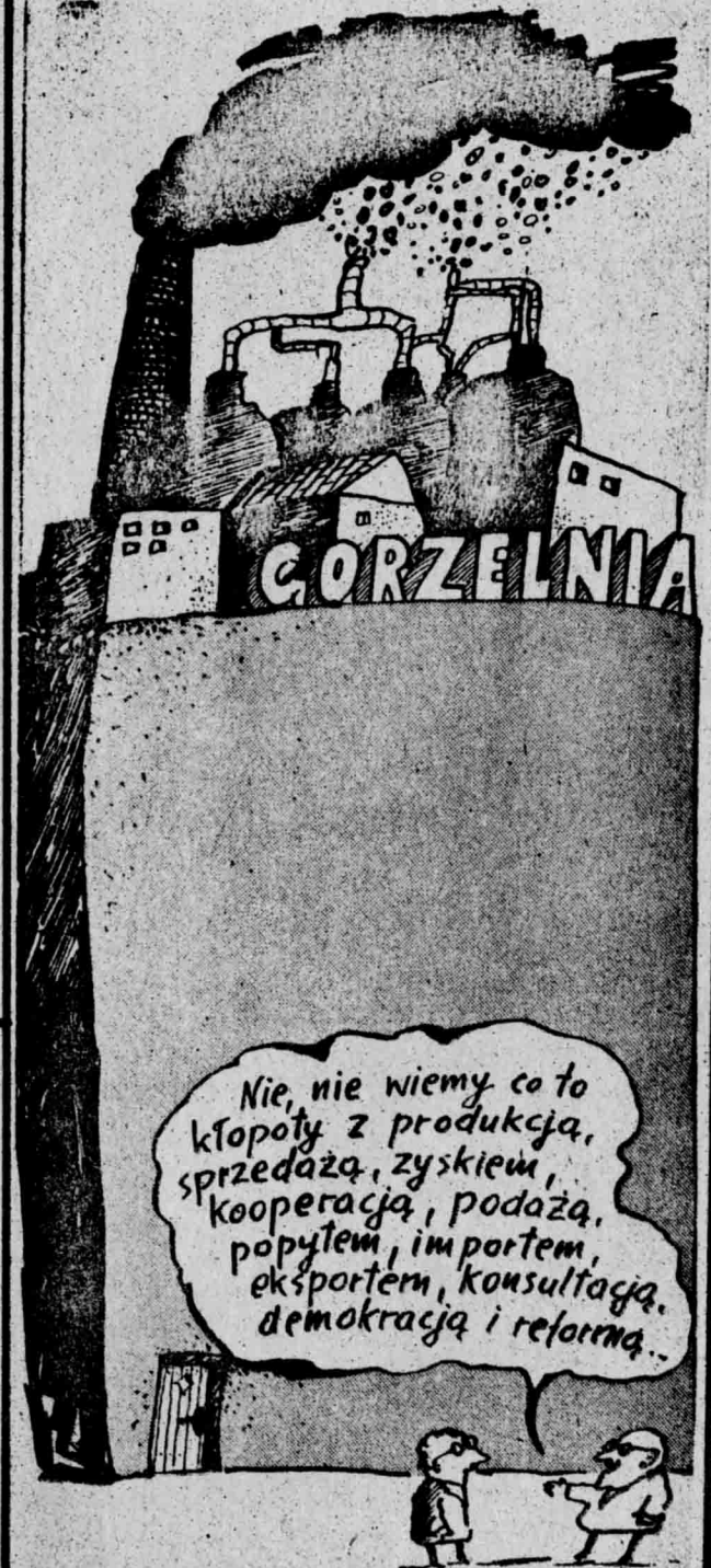
Rys. Marek Polański „KAMULELA” 1977.