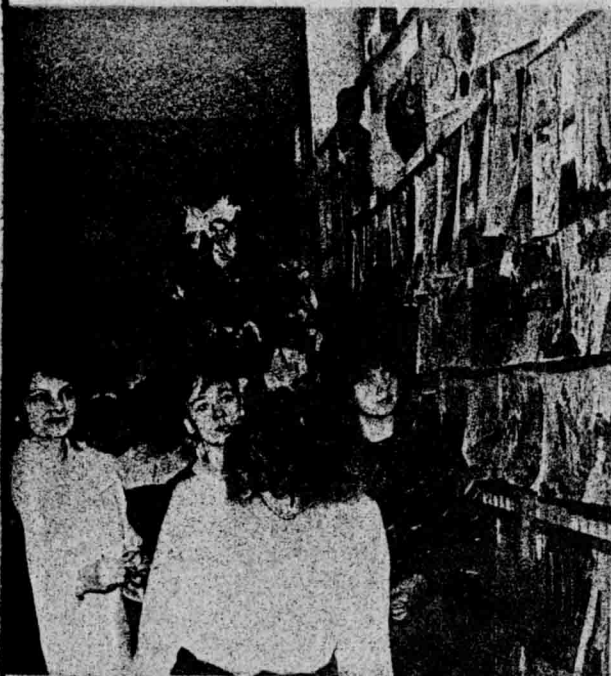
UCZESTNICY SYMPOZJUM LOP WYBIERAJĄ NAJLEPSZĄ PRACĘ W KONKURSU „PRZYRODA TWOJ PRZYACIEL

Głównym celem ochrony środowiska i przyrody jest na całym świecie ochrona zdrowia i życia ludzi.