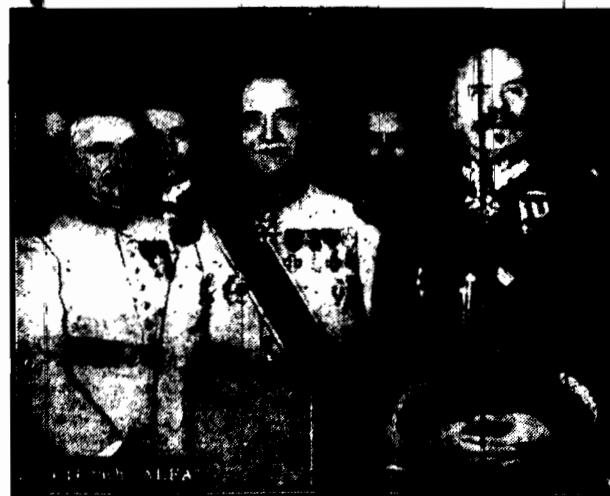
gen. CHARPY w otoczeniu wiceministra spraw wojskowych, gen. Konarskiego i szefa szta- bu gen. Pulo. Zdjęcie fotograficzne wykonane na bankiecie pożegnaniowym w Warszawie.