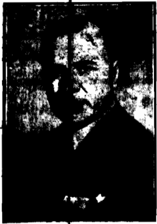
p. wiceminister S. Car od 3 tygodni prowadzi bez przerwy obla- dowej od godz. 9 rano do godz. 4 — 5 rano. (Str. 2-ga).