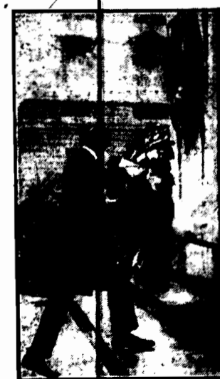
Rząd angielski stanował generalnym gubernatorem Irlandii wybitnego polityka Jamesa Mac Neilla. Na zdjęciu gen. gubernator składa wieniec w sali obrad parlamentu irlandzkiego.