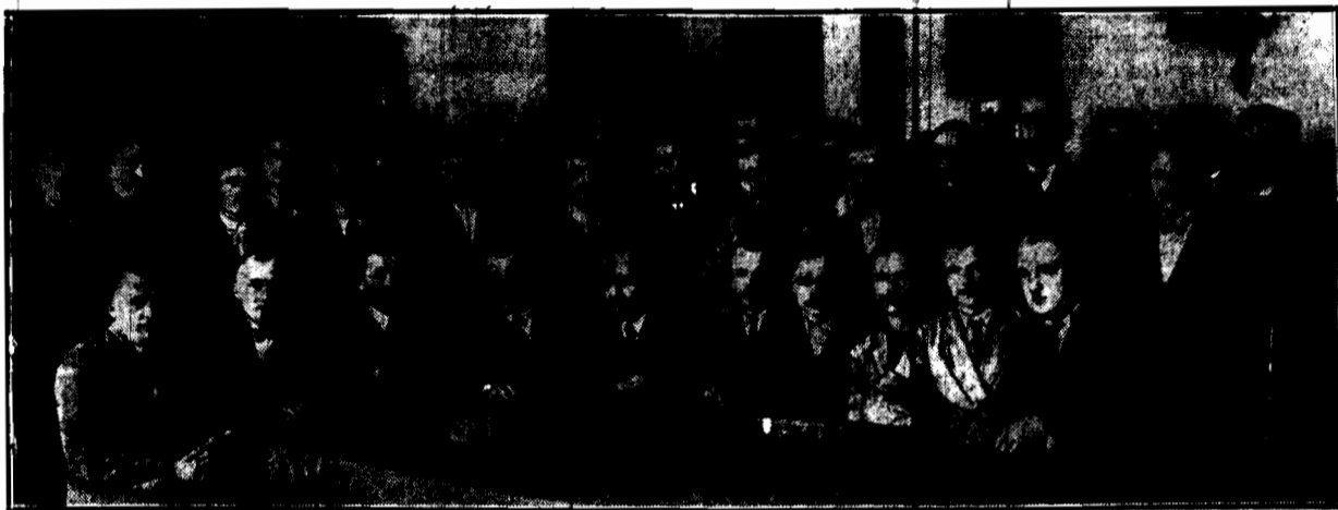
Pa audyencji u Marszałka Piłsudskiego na konferencji z pułk. Sławkiem (p. str. 2).