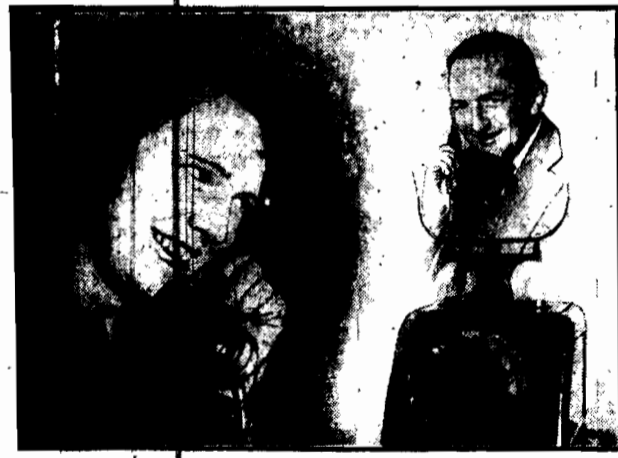
Obrazek dziś jeszcze fantastyczny, jutro stać się może rzeczywistością: osoby rozmawiające przez telefon widzą się wzajemnie. W Anglii i Ameryce naukowcy wynalazcy pracują nad skonstruowaniem odpowiednich aparatów.