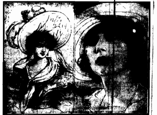
Dwa modne kapelusze eleganckie wareszawskich.