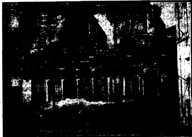
W tym miejscu prowadzone są prace nad całkowitym odkopaniem domu, który ongi był własnością i miejscem zamieszkania Poncjusza Piłata. Jak widać na zdjęciu, dom zachował się zupełnie dobrze.