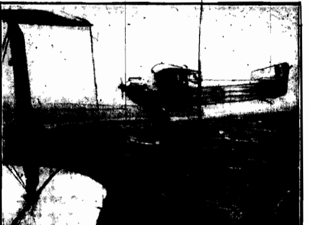
250 aparatów wzięło udział w napowietrznych manewrach nad Anglią.