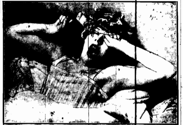
Staroświeckie papiloty rzadko kiedy są obecnie używane bowiem na ich miejsce jest sto różnych przyrządów. Niekiedy jednak jeszcze i teraz papiloty bywają w użyciu, jak dowodzi zdjęcie powyższe.