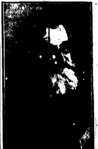
Jeden z wybitnych działaczy bolszewickich, teoretyk bolszewizmu, Feliks Kon, pochodzący z b. Kongresówki.