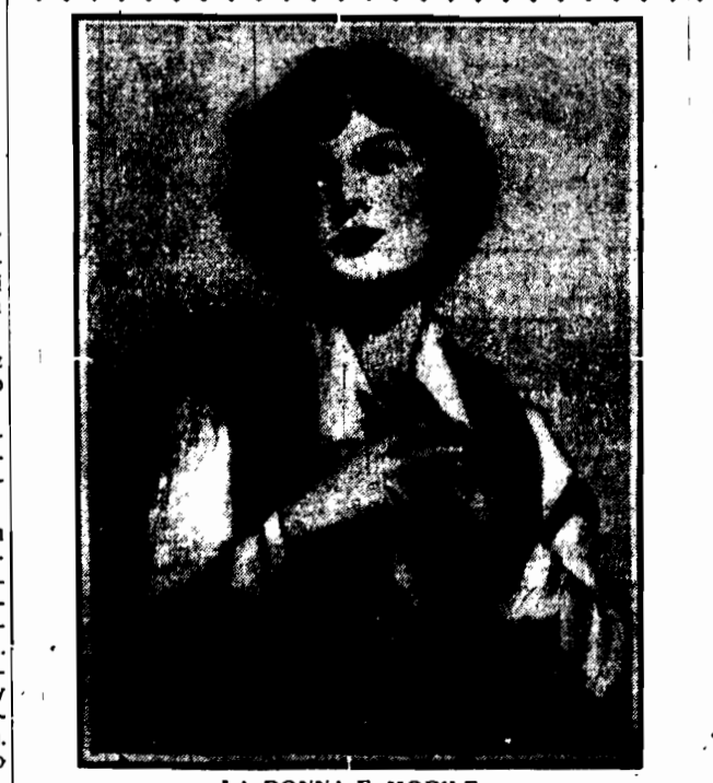
LA DONNA E MOBILE... Kobieta zawsze pono płocha. To kłamstwo i wnet legnie w pył. Ody ręką prawdy da mu pszytyczek. No i tych, których „wernie” kocha, Jak rokawiczki ciągnie gniemka, „Jym” „wernym” świątecznych rekawiczek?