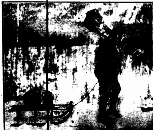
Operator filmowy, a i każdy fotograf-dziennikarz, musi wolens - wolens być mekiedy sportmenem. Tam, gdzie chodzi o zdjęcia sportowa. Na zdjęciu operator filmowy w Warszawie, który właśnie się pracuje na zdjęcie, by dokonać zdjęć z zawodników marcewskich.