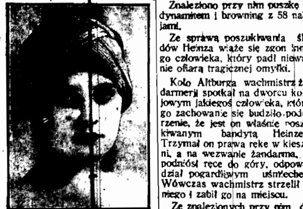
Wiosennego: turban z czarnej satyny przepięknie ozdobił wstążki z jasną szarfą.