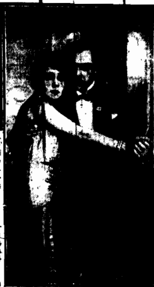
CAR ROSYJSKI IN PARTIBUS