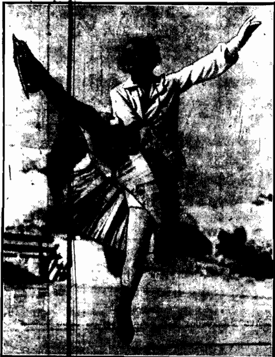
Niemiecka mistrzyni łyżew p. Brockhöft wprawia się przed olimpiadą zimową w jeżdżenie figurowej na torze w Saint Moritz