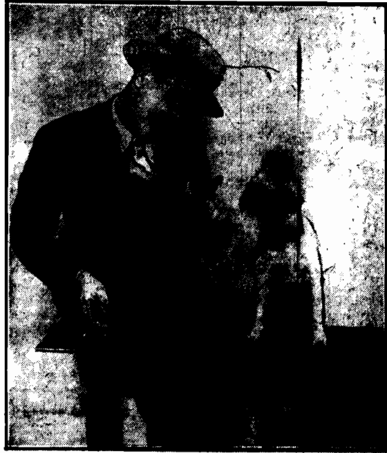
Amerykański artysta filmowy Johnny Hines, zdjęty wraz ze swym psem, który niejednokrotnie występował na ekranie