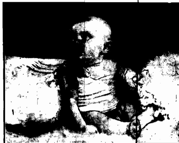
Najmłodszy syn dyktatora Włoch, Mussoliniego, kilkunastoletni Romano jest trzecim z rzędu dziedzicem swego ojca. Wzrostu posiada ciążość dynastji z pewnością.