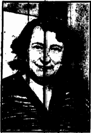
Wnuczka stryjeczna znakomitego muzyka Schuberta...