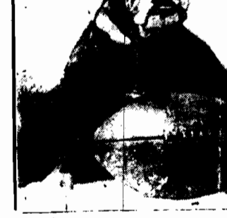
Studenci niemieccy zawsze lubowali się w psiej karykaturze, twierdząc, że posiadanie ich przynosi szczęście w egzaminach...