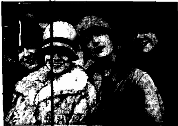
Do Paryża zjechała grupa t. zw. manekinów z nowojorskich magazynów mód, celem doskonalenia się w swym szczególnym fachu