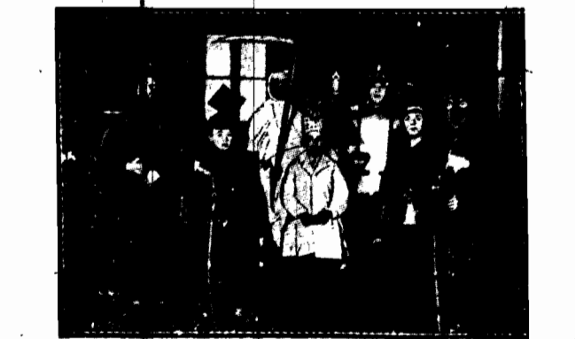
W okresie świątecznym działwa podwarszawska przebiera się w własnego pomysłu, a nieraz i wyrobu kostiumy i ugania się po ulicach, budząc sensację...