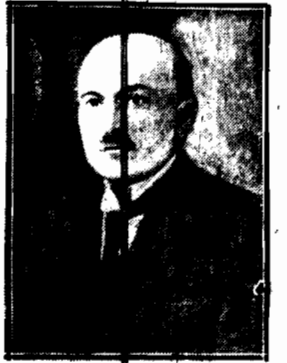
Zygmunt Wilki — Zygmunt IV.