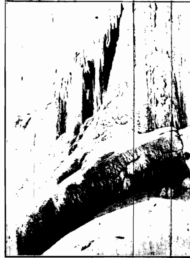
Wspaniały widok przedstawia największy na świecie wodospad Niagara, gdy go pokrywa pancerz lodu. Zdarza się to, oczywiście tylko podczas bardzo silnych mrozów