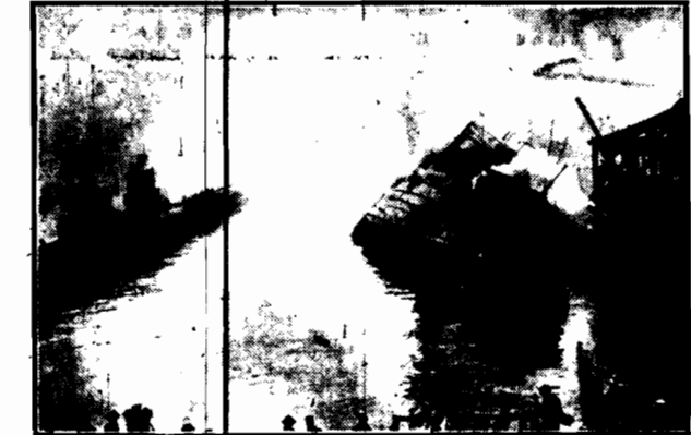
W porcie amerykańskim Hoboken wybuchł pożar, na okręcie handlowym „Seneca”. Pomimo energicznego ratunku, w którym brał udział specjalny parowiec pożarny, „Seneca” sponął niemal doszczętnie