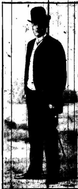
MIECZYSLAW FRENKIEL w roku 1881.