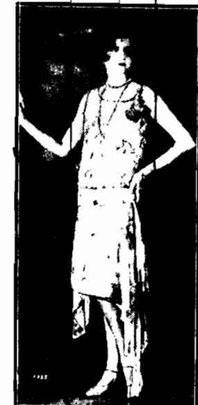
Jako uzupełnienie stroju naszyjnik z perel, które w dalszym ciągu są modne.