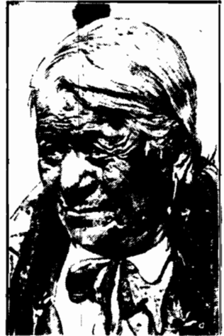
Zona kacyka jednego z plemion czernoskórych doczekała 104-ech lat wieku. Starownia trzyma się bardzo dobrze, jest zupełnie zdrowa i uwielbia „wodę oguista”.