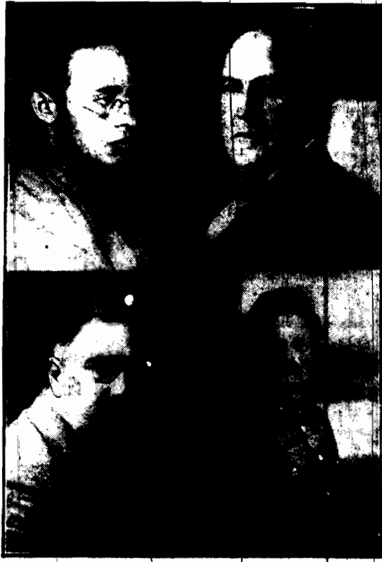
Czterej przywódcy opozycji rosyjskiej, zesłani przez rząd sowiecki na Syberię. U góry: po lewej Radek, po prawej Rakowski. U dołu: po lewej Kamieniew, po prawej Trocki.