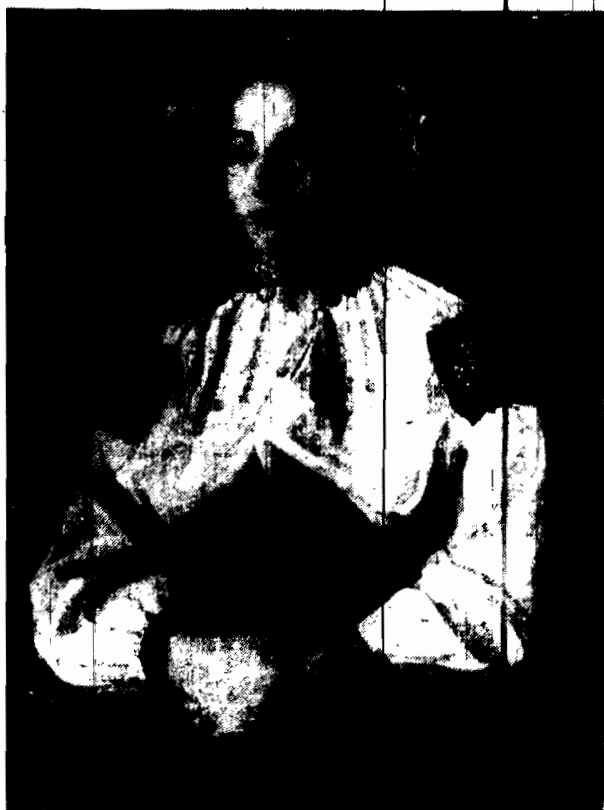
Typ biuński mal. A. Trzaskaw

BERLIN 13.1. W Stanowitz podczas pożaru domu, zamieszkanego przez 8 rodzin, zginęło w płomieniach troje dzieci w wieku od 3 do 5 lat.