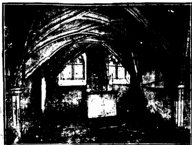
Święto ukończono w Górlcach na Śląsku budowę kościoła, stanowiącego dawną kopię kościoła Grobu Pańskiego, w Jerozolimie. Na zdjęciu — lewa nawa wraz z ołtarzem.

znaleziono w jednej z bocznych ulic trupa Worskiego. Zamordował go nieznanymi jakis sprawca.