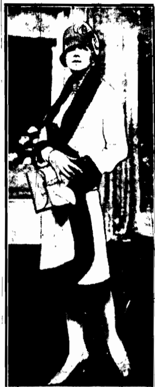
Piękne okrycie zimowe z jasnego akşamitu, ubranego ciemnym futrem.