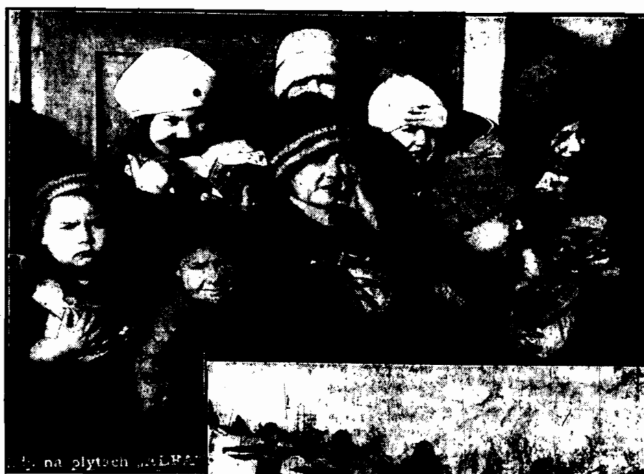
„GWIAZDKA” W PRZYTYŁKU DLA DZIECI Rozradowane buźki świadczą, że podarki gwiazdkowe podobają się ogólnie.