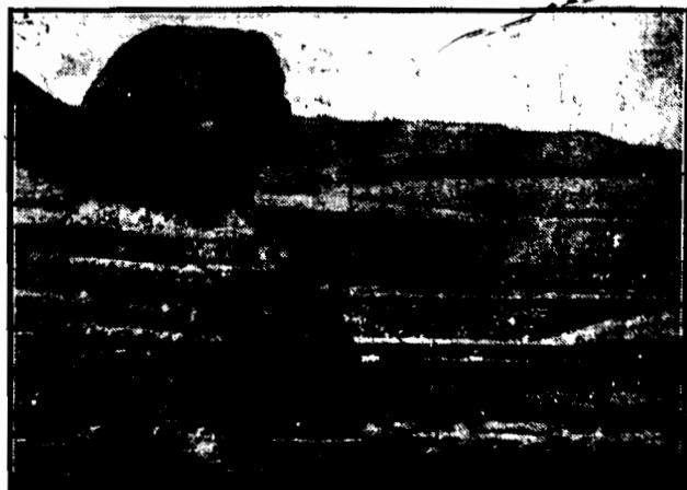
Ustanowiono prace nad odkopaniem całkowicie obrzydnego sfinksa w Orlach, który dotychczas był w znacznym stopniu zasypywany piaskiem.