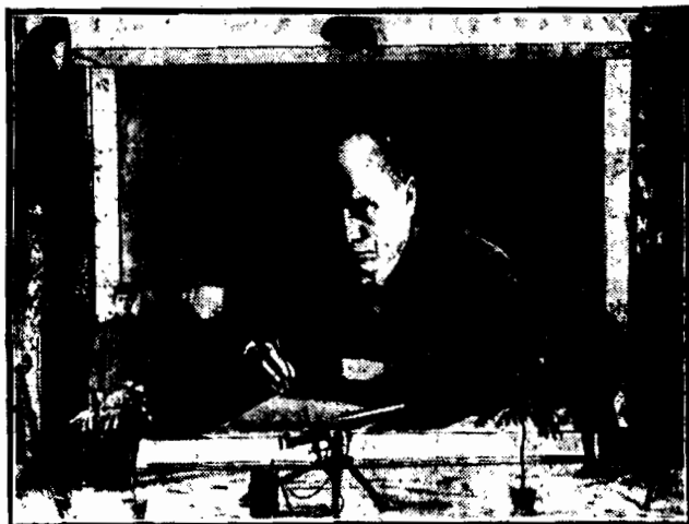
W Rzymie wystawiono na widok publiczny kolosalnych rozmiarów portret dyktatora Mussoliniego. Portret 6 metrów długości, 4 i pół metra wysokości i jest dzień i noc strzeżony przez uzbrojonych faszystów