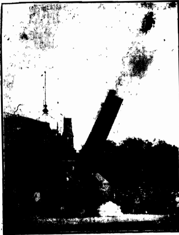
Stukmistrz Lehnart, popisuje się w cyrkach zagranicznych. Jako człowiek-pocisk. Wlazł on do wnętrza wielkiej armaty, skąd wylatuje przy huku wystrzałów na wysokość 80 stóp i spada w siatkę.