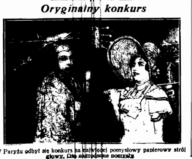
W Paryżu odbył się konkurs na najwęższą pomysłowy papierowy stróż głowę. Oto niezgodne pomysły

— Ja ci pokażę! Popamiętasz mnie jeszcze! Przeszło kilka dni, zajęte puszczono w niepamięć. Onegdaj około godziny pierwszej w południe drzwi zakładu Grajewskiego otwarły się z traskiem;