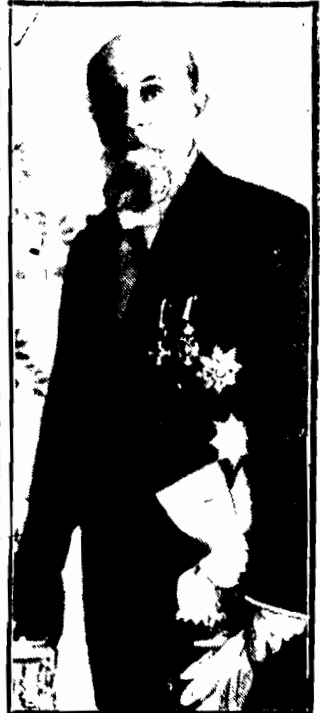
Prezes ministrów Jugosławii Wukotycz, twórca traktatu francusko-jugosłowiańskiego, a zarazem nowoj polityk bałkański.