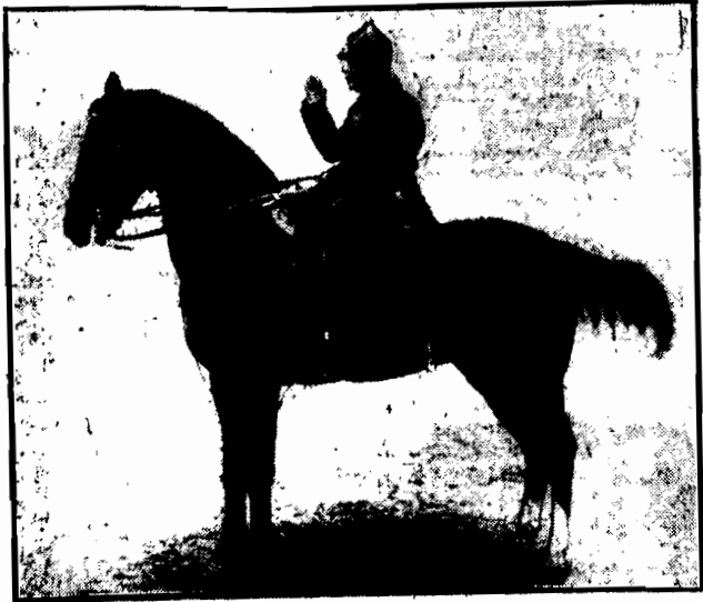
Pełnopięcioletni Trocki jako naczelny dowódca armii rosyjskiej obłaj Woroszyłow.