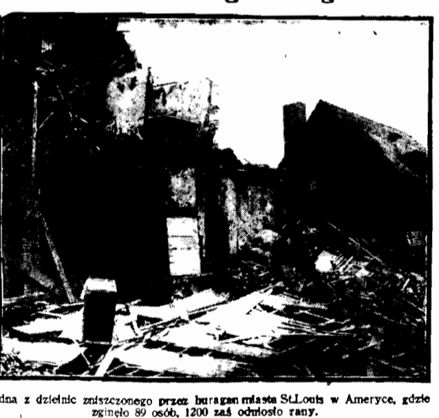
Jedna z dzielnic zniszczonego przez huragan miasta St.Louis w Ameryce, gdzie zginęło 89 osób, 1200 zaś odniosło rany.