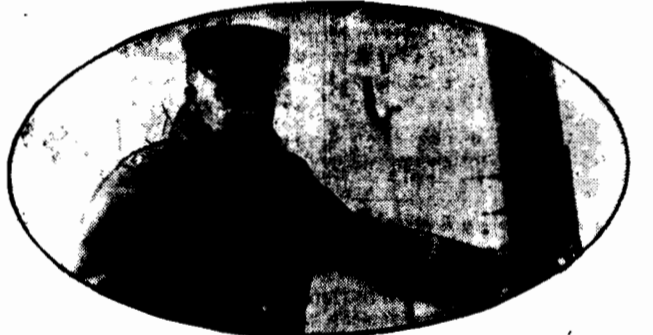
Wczoraj o godz. 7-ej rano stanął w Warszawie po podróży z Wilna, Marszałek Piłsudski, rzeźbi, zwawy i wypoczął, mimo drogi i nocy spędzonej w wagonie.