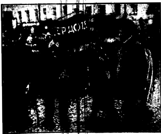
W pochodzie, który z racji rocznicy rewolucji bolszewickiej przeciągnął ulicami Moskwy, prowadzono dziwnie przystrojonego wołu. Czyżby miał on symbolizować obywatela rosyjskiego, w którego tak wielką orzę halabaldęw spekulantów politycznych?