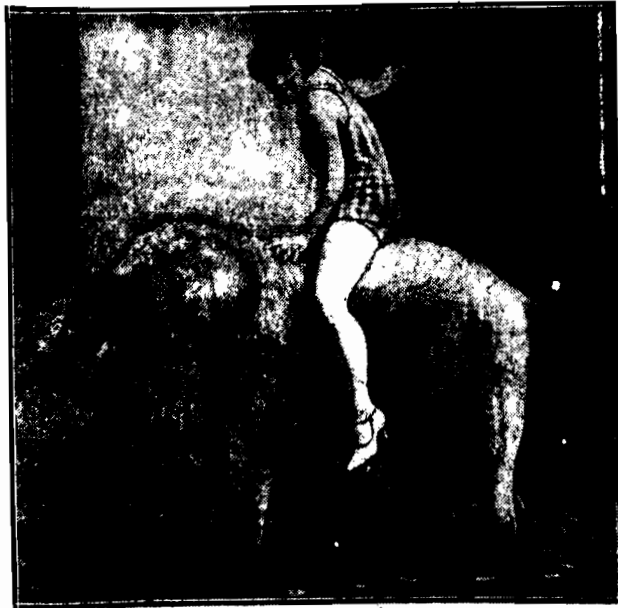
Jazde par force na „nieosiądnym” słoniku uprawia znana artystka filmowa F. de Brink. Niczyt to szybki, ale za to pewny sposób lokomocji, a w danym wypadku — schudnięcia.

Czytajcie „Przegląd Sportowy” Cena 30 gr.