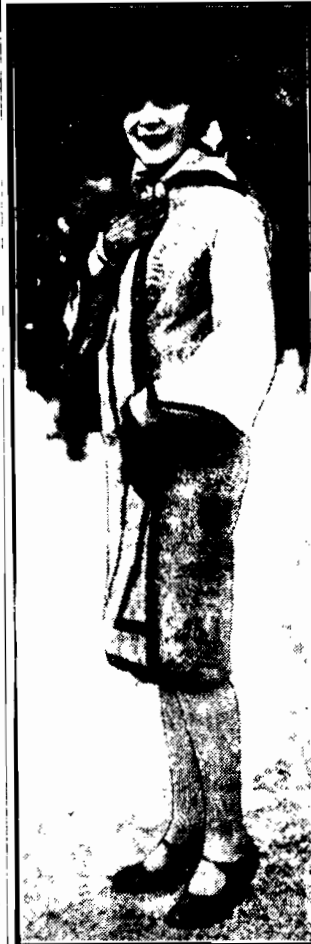
Najnowsza moda paryska. Zdjęcie zrobione w łasku Bulońskim