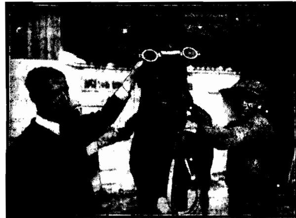
W stadninach koni rasowych w Anglii wprowadzono dla koni okulary. Mają one chronić oczy zwierzęcia od kurzu i pędu powietrza w czasie wyścigów