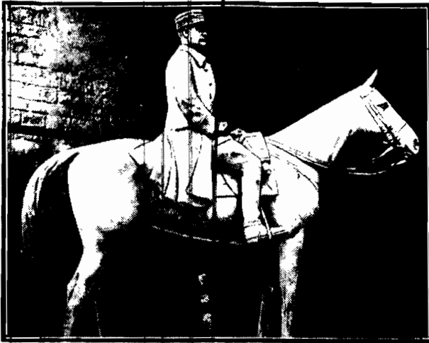
dzieło rzeźbiarza Mahissanda będzie wkrótce odsłonięty w Cassel — we Flandrii.