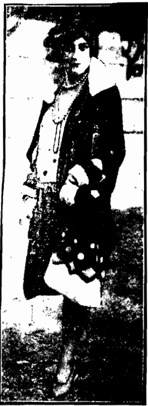
Jako ozdoba okryć jesiennych. Zdjęcie zrobione w Longchamps pod Paryżem