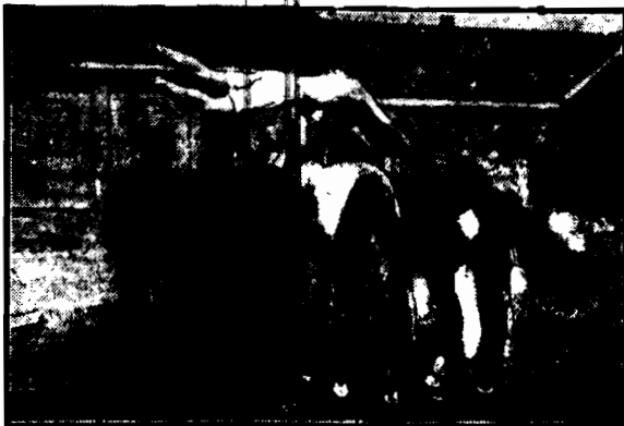
Ćwiczenia kawalerji angielskiej przypominają niekiedy popisy akrobatów cyrkowych, jak np. taki skok przez 4-y konie.