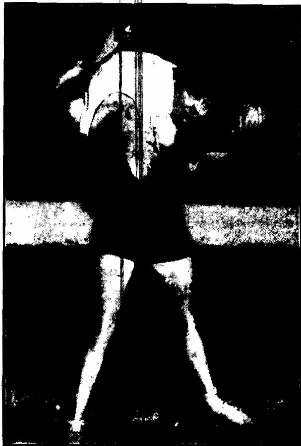
Moment z ćwiczeń drużyny atletycznej pań.