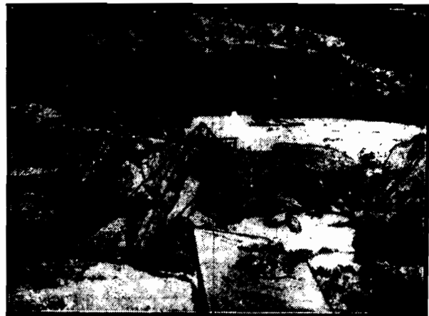
Wzburzone fale górnego Renu zerwały betonowy most, z którego pozostały tylko gruzy