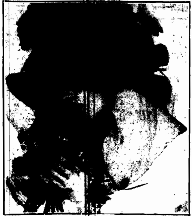
„Zapytaj kwiatów! Włoch powiedza one „To, czego serce nie mówi stęsknione” — Szeptem poeta. Ona kwiatów pyta. Potem mknie z innymi na dancing i kwiaty...