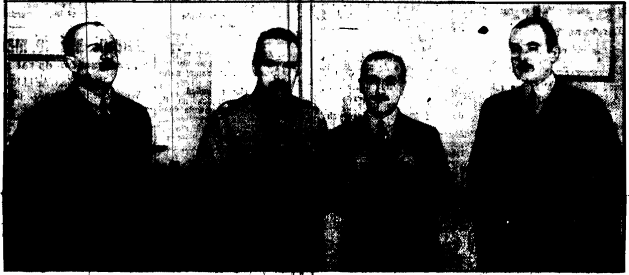
Minister Pilsudski w obecności wicepr. Bartis przy podpisywaniu umowy o pożyczkę w Belwederze. Obok niego: gen. M. Monetta i J. Fishera.