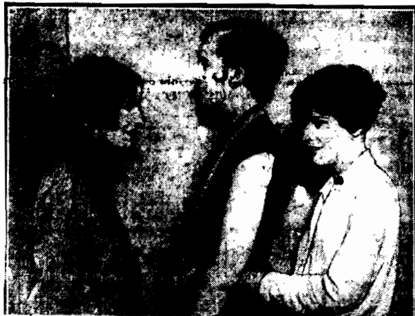
Z wystawy fryzjerskiej w Londynie. Trzy rodzaje fryzury damskiej (od lewej): wczoraj, dzis, jutro. Środkowe uczesanie jest obecnie w Londynie najmodniejsze