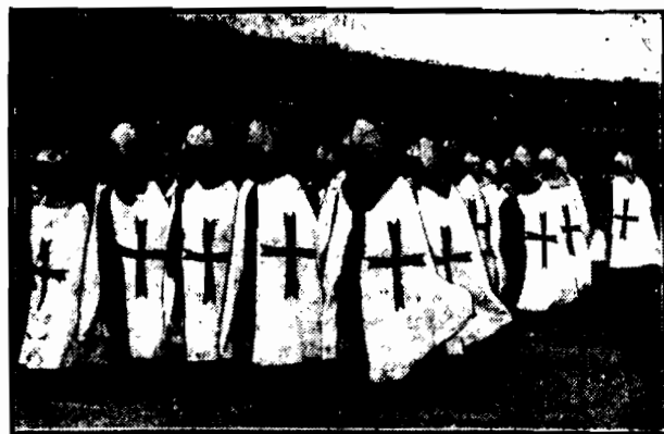
W czasie uroczystości z okazji 80-letniej rocznicy urodzin Hindenburga ogólna uwaga zwróciła defilada przed prezydentem Niemiec oddziału rycerzy zakonu Joannitów w historycznych kostiumach.