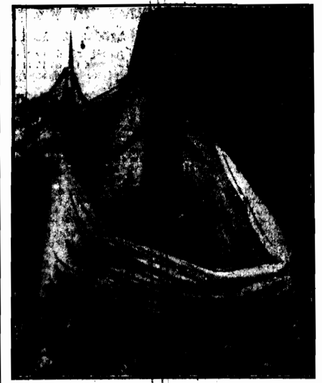
odsłonięty w obecności Prezydenta Rzeczypospolitej w ubiegłą niedzielę.