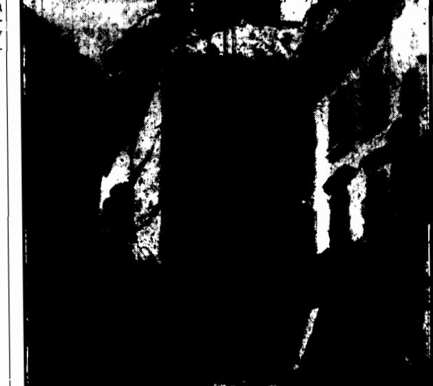
Mal. T. CIESLEWSKI