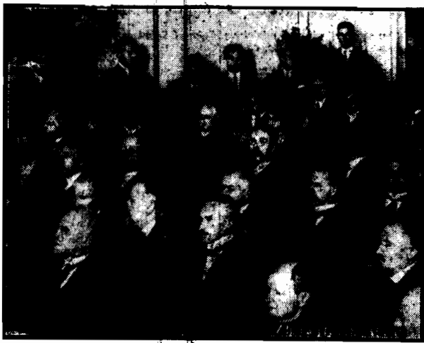
W stołeczki rozpoczął obrady drugi zjazd filozoficzny i potrwa do dnia 28 b. m. Miejscem obrad jest gmach główny Uniwersytetu warszawskiego. Na zdjęciu fragment sali w czasie obrad.